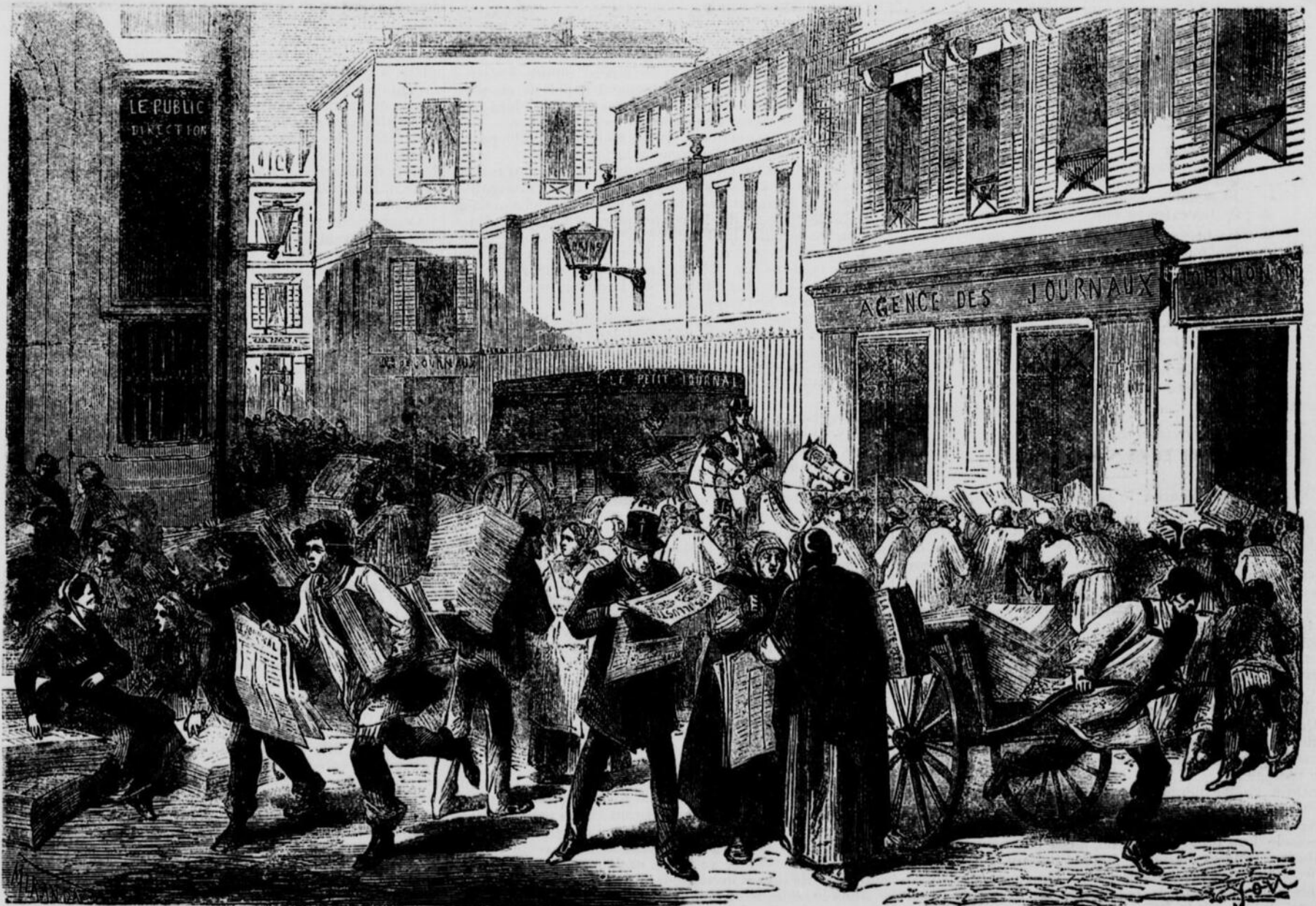
Halle aux Journaux à Paris.