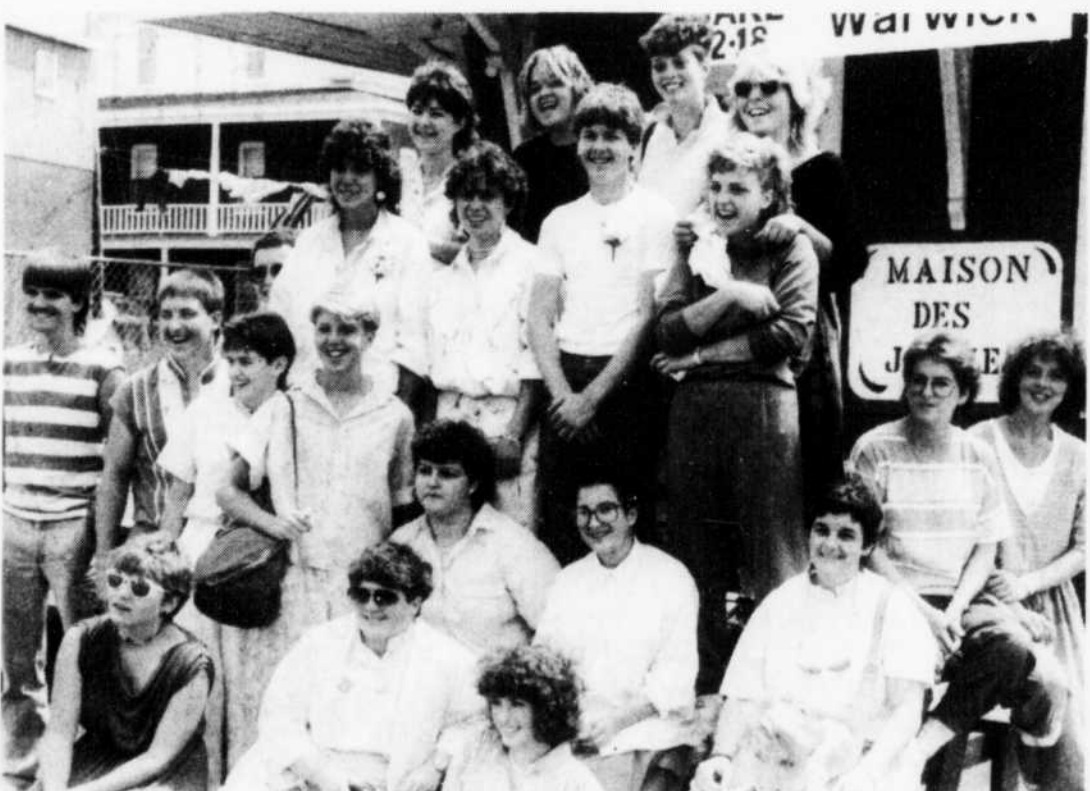
Ces 26 jeunes ont quitté Warwick, hier, pour un voyage de trois semaines en France.