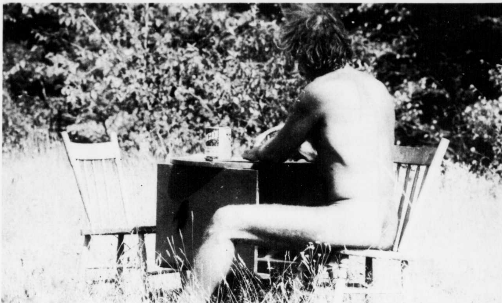
Le groupe Plein Soleil a choisi un décor tout à fait enchanteur, le ruisseau de la clef (Key brook) à St-Denis-de-Brompton, pour établir son premier camp naturiste.