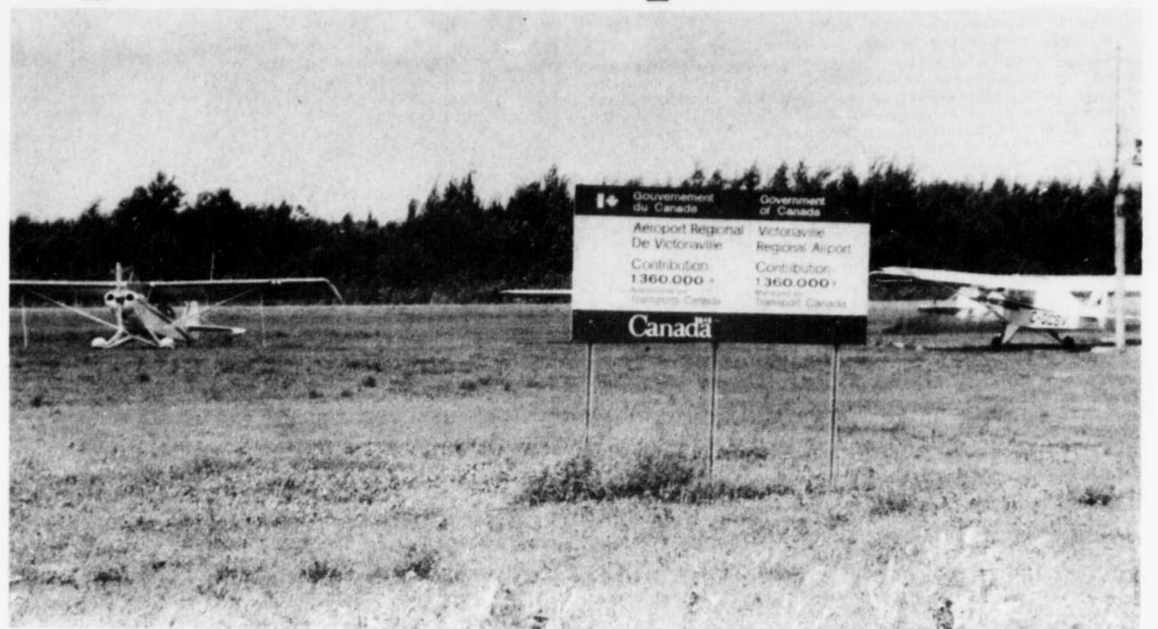
Le ministère de l'Environnement recevra dans les prochains jours, l'étude définitive d'impact du projet d'agrandissement de l'aéroport.