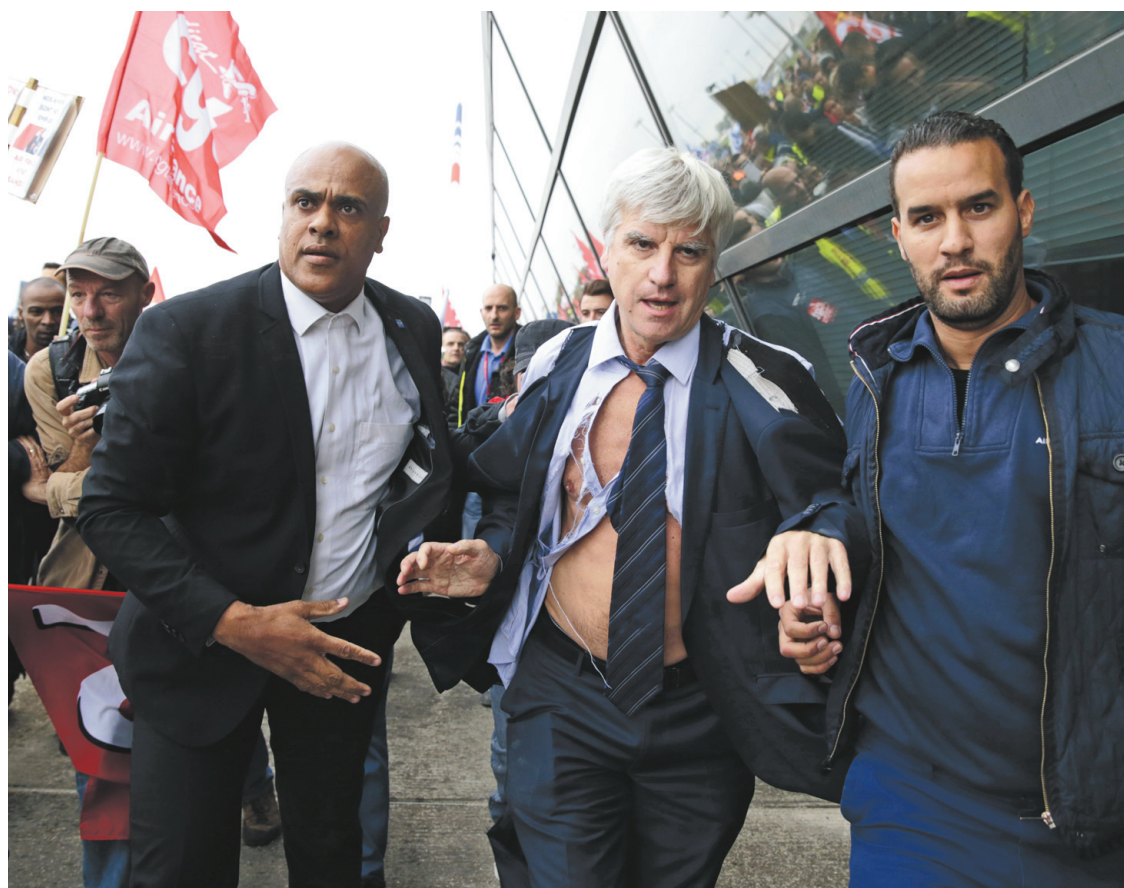
Un cadre d'Air France, les vêtements en lambeaux après avoir été pris à partie par des employés, est escorté par des agents de sécurité du transporteur aérien.