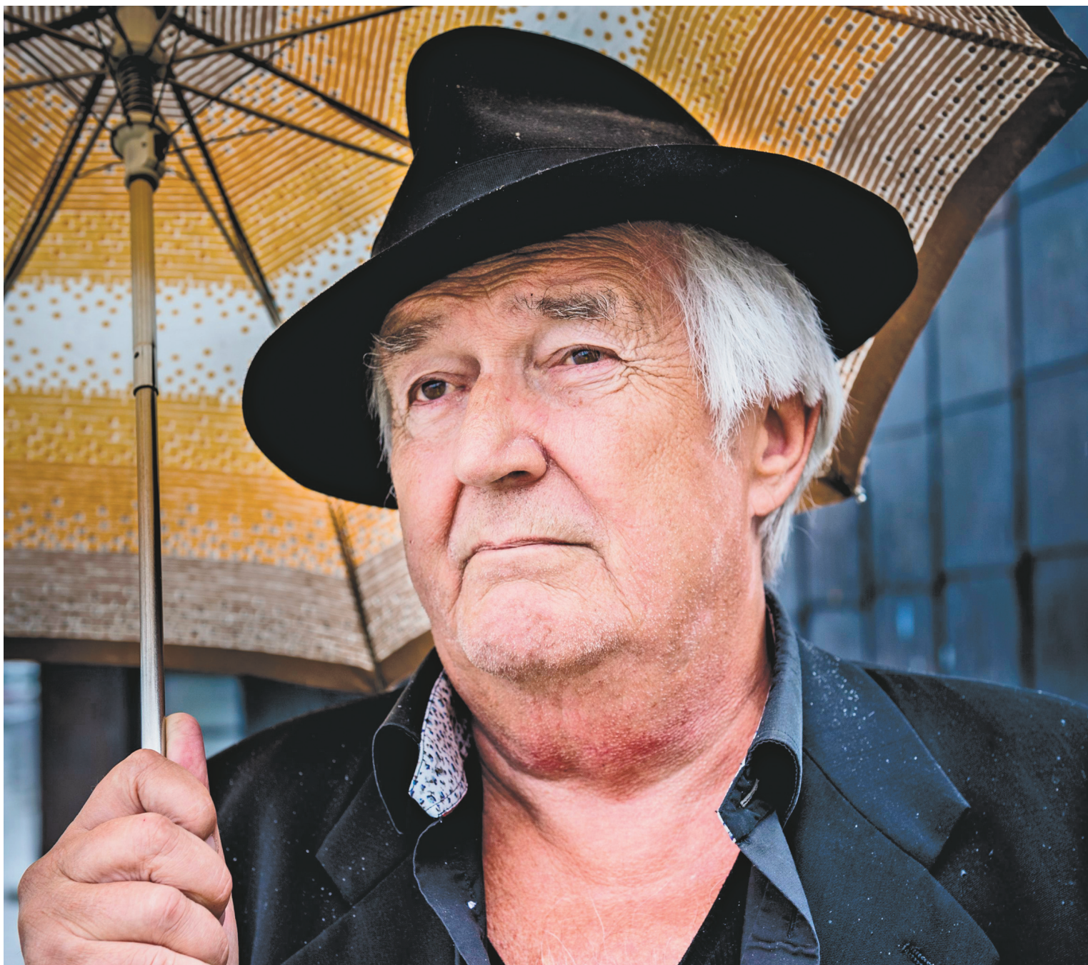
NORA LOREK AGENCE TT / ASSOCIATED PRESS

Un dessin rare de Tintin, de l'auteur de bande dessinée belge Hergé, a été adjudgé pour plus de 1,6 million de dollars lundi lors d'une vente aux enchères à Hong Kong. Dessinée en noir et blanc, l'œuvre est un original du volume Le Lotus bleu , paru en 1936, et montre le héros à houpette transporté en pousse-pousse dans une rue de Shanghai sous l'œil d'un policier. Elle a été achetée pour 1,1 million d'euros (1,61 million de dollars canadiens) par un collectionneur asiatique, a annoncé la maison de vente aux enchères française Artcurial. Ce dessin est le dernier original du Lotus bleu encore en circulation, tous les autres étant la propriété de musées, selon Artcurial. « Le Lotus bleu est considéré par les experts comme l'album chef-d'œuvre d'Hergé », a assuré Eric Leroy, expert en bande dessinée chez Artcurial. « Le trait et le dessin d'Hergé étaient arrivés à maturité [...] C'était de plus inhabituel de parler de la Chine dans les années 30 en Europe », a-t-il ajouté. Agence France-Presse