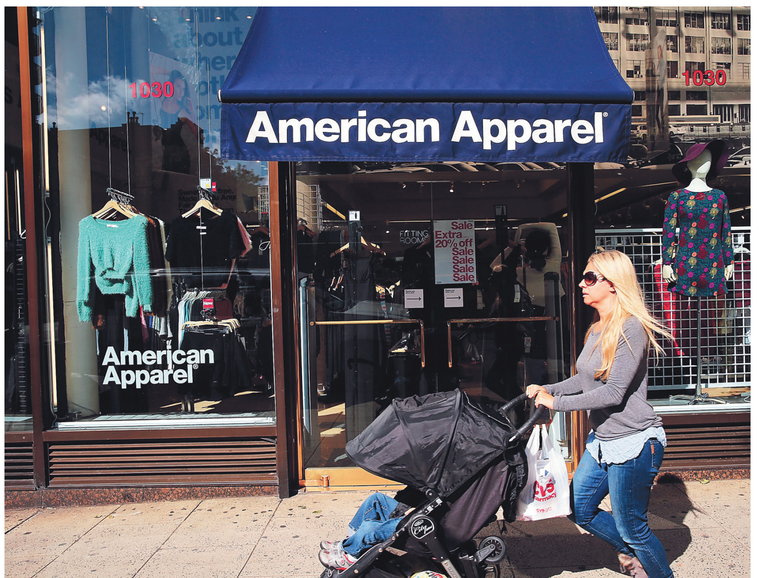
SPENCER PLATT AGENCE FRANCE-PRESSE

American Apparel perd de l'argent depuis 2010.