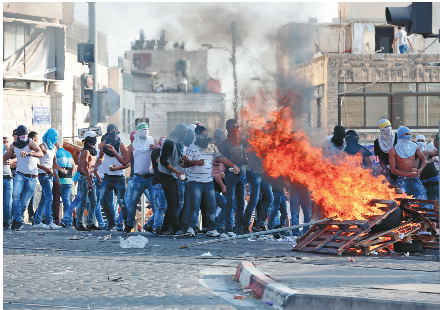
Les heurts et les violences se poursuivent à Jérusalem-Est.