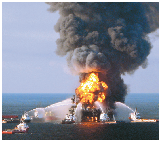
La plateforme pétrolière Deepwater Horizon avait pris feu en avril 2010.

plémentaires si d'autres sont identifiés —, et 600 millions pour des réclamations diverses. Par ailleurs, le groupe britannique a conclu des accords distincts d'un total de 4,9 milliards avec les cinq États affectés, et d'un milliard avec plusieurs centaines d'entités administratives locales. Soit 20,8 milliards au total. « Avec cette transaction amiable, les autorités fédérales, des États et locales ainsi que des communautés de la région côtière du golfe auront les ressources pour effectuer des progrès importants vers la restauration des écosystèmes, des économies et des entreprises de la région », a assuré M me Lynch. Les opérations de secours au moment de la catastrophe lui avaient coûté 14 milliards. En 2013, il avait plaidé coupable à onze chefs d'accusation au pénal et acquitté une amende de 4,5 milliards. Mais des actions judiciaires en nom collectif sont toujours en cours.