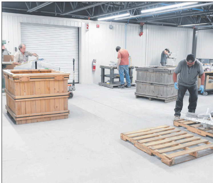
Tous les départements disposent d'une aire de travail spacieuse.

La compagnie se spécialise dans la fabrication de mobilier urbain tel que les bancs publics, les poubelles, les bacs à fleurs, les tables à pique-nique. Elle s'inscrit dans le créneau de haut de gamme, un marché encore en développement, selon M. Thuot.