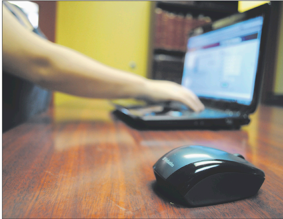
Donner des informations personnelles sur le Web est rarement une bonne idée.

Ces arnaqueurs se dépêchent habituellement de faire sortir leur victime du cadre du site de rencontre et leur demandent ensuite des informations personnelles et de l'argent. L'idéal demeure