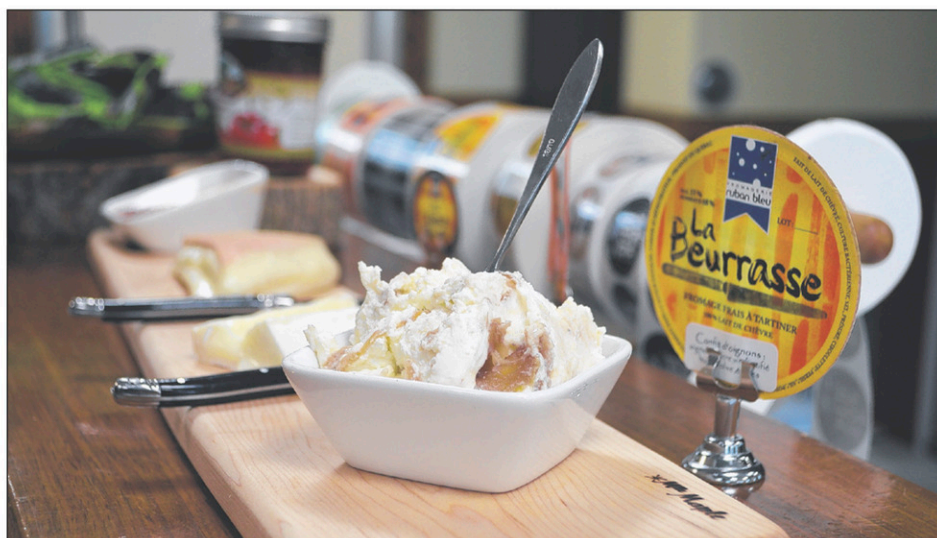
Les amateurs de sucré-salé tomberont en amour avec La Beurresse, un fromage de chèvre frais à tartiner disponible nature ou aromatisé au confit d'oignons. C'est une création du Ruban bleu.