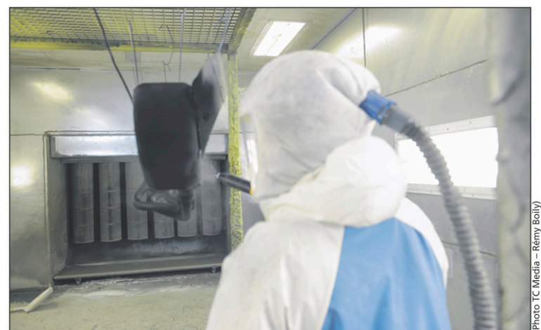
Les pièces sont peintes avec de la peinture en poudre.

Quand elle a opté pour ce type de peinture, Équiparc a d'abord fait appel à la sous-traitance. Puis, lorsqu'elle a décidé