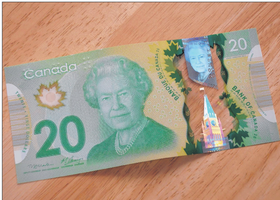
La coupure de 20$ demeure la plus prisée des faux-monnayeurs.

La présence de faux billets sur les marchés canadiens et québécois demeure un