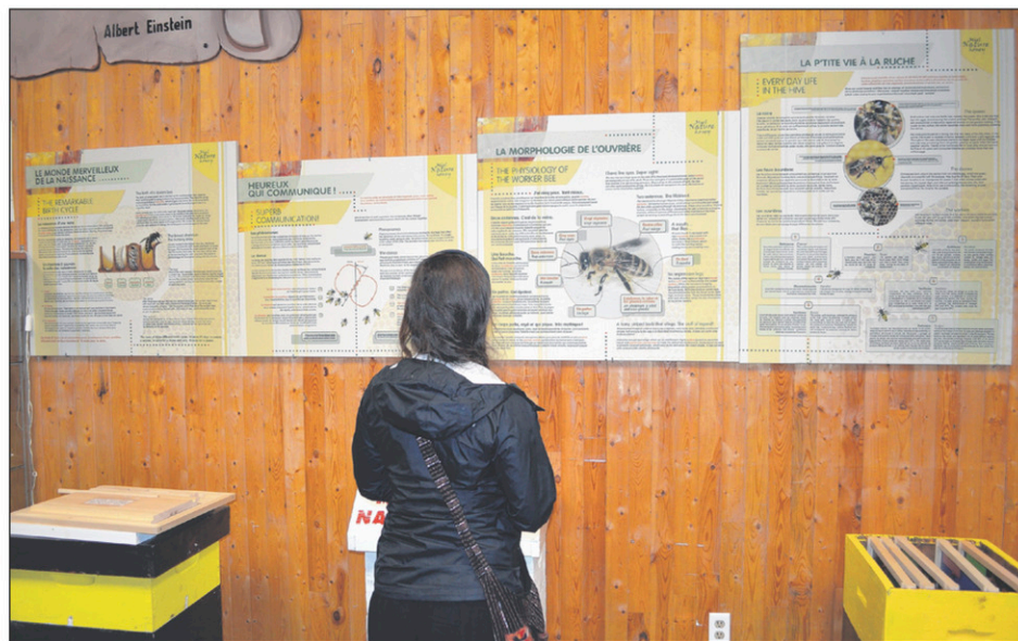
Le Centre d'interprétation du miel et de l'hydromel permet d'en apprendre davantage sur les abeilles. Il est situé chez Miel Nature, à Beauharnois.