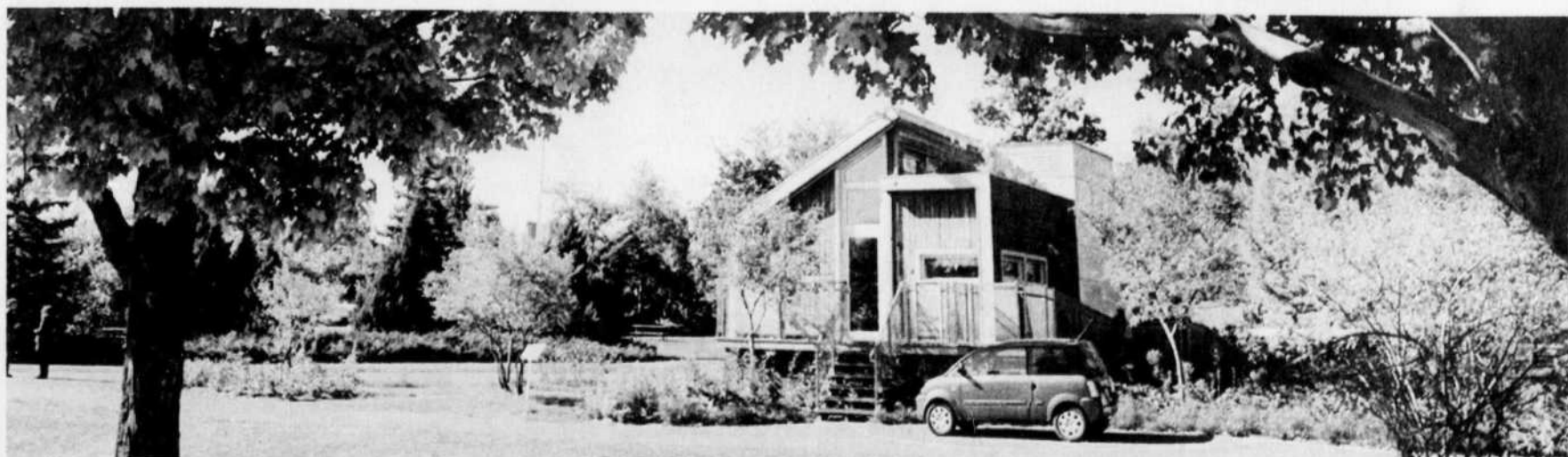
La maison solaire qui trône sur le terrain à côté de la Biosphère permet de voir concrètement comment on peut changer ses habitudes au quotidien. Si sa façade est moins verdoyante en automne qu' l'été, l'intérieur de la maisonnette est rempli de pistes écologiques pour passer au vert quatre saisons par année.