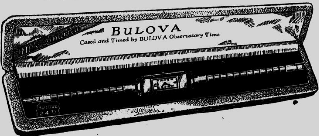
UNE MONTRE BULOVA