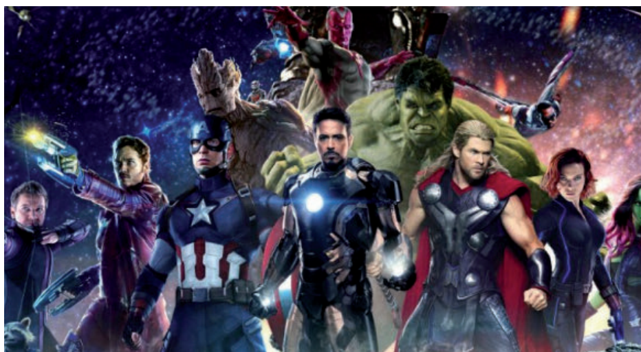
Une photo promotionnelle du film Avengers - La guerre de l'infini dans lequel sont réunis tous les personnages de l'univers cinématographique de Marvel.

Faisant suite à la semaine dernière, voici ma deuxième partie de mon top 10 des meilleurs films de 2018.