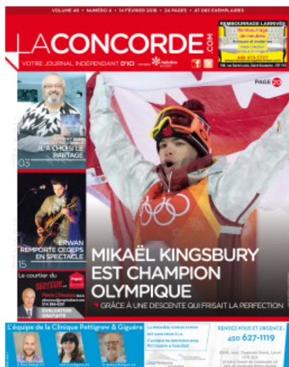
LA CONCORDE, 14 février 2018.