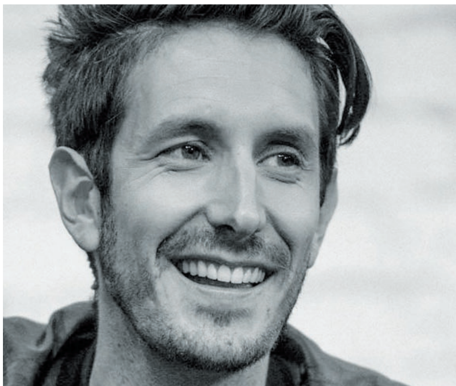
L'humoriste Jérémy Demay sera en spectacle à la salle Le Zénith Promutuel Assurance le 5 janvier.

Le samedi 12 janvier, 14h, bibliothèque Guy-Bélisle, Saint-Eustache: LES FOSSILES. Présenté par le Musée Redpath. Public-cible: 6 à 12 ans. Entrée libre; nombre de places limité (30); activité réservée aux abonnés de la bibliothèque. Inscription en ligne au [www.saint-eustache.ca].