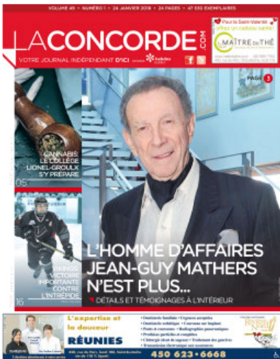
LA CONCORDE, 24 janvier 2018.