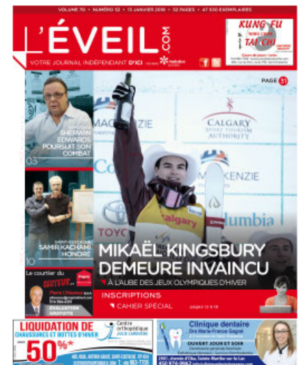
L'ÉVEIL, 13 janvier 2018.

Le personnel de la Commission scolaire de la Seigneurie-des-Mille-Îles (CSSMI) a de quoi se réjouir, puisque le taux de décrochage scolaire pour l'ensemble de ses écoles secondaires se situe à 8,5 %, soit 12,5 % chez les garçons et 5 % chez les filles.