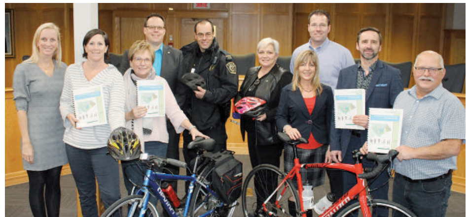
Les élus municipaux ont adopté à l'unanimité un ambitieux plan directeur du réseau cyclable.

Lors d'une récente séance ordinaire du conseil municipal, les élus de la Ville de Saint-Eustache ont adopté à l'unanimité un ambitieux plan directeur du réseau cyclable, dont certaines recommandations sont déjà mises en branle, alors que d'autres se concrétiseront dès le printemps prochain et au cours des prochaines années.