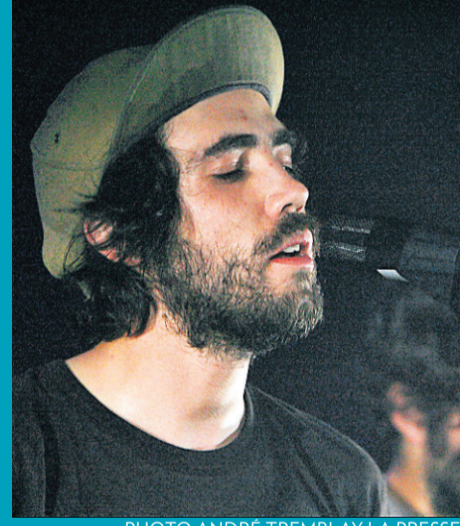
Patrick Watson