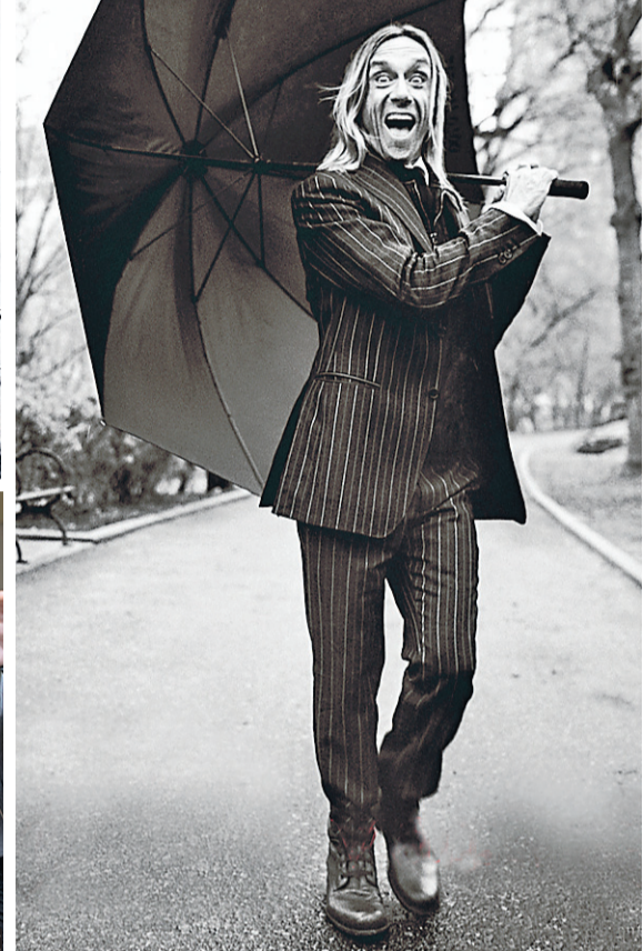
De gauche à droite en commençant par le haut: les campagnes publicitaires de Varvatos avec les membres de Franz Ferdinand, Perry Farrell (Jane's Addiction), Slash de Velvet Revolver (ex Guns N'Roses), Iggy Pop et les Montréalais The Stills, en compagnie de John Varvatos.