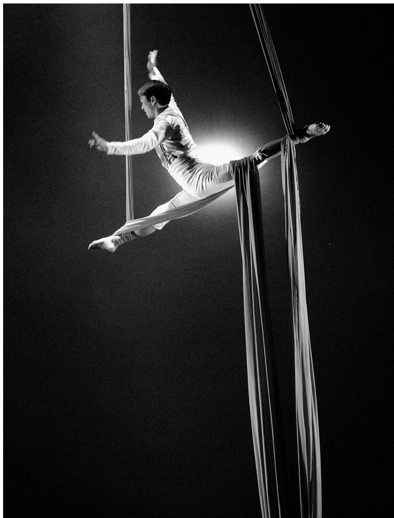
Toutes les forces vives du milieu – Cirque du Soleil, Cirque Éloize, Les 7 doigts de la main, la TOHU, l'École nationale de cirque et le regroupement En Piste – collaborent depuis l'automne dernier à mettre sur pied un festival.

«Nous, Québécois, nous avons réinventé l'art millénaire du cirque. Nous avons le Cirque du soleil, le Cirque Éloize, Les 7 doigts de la main, la TOHU,