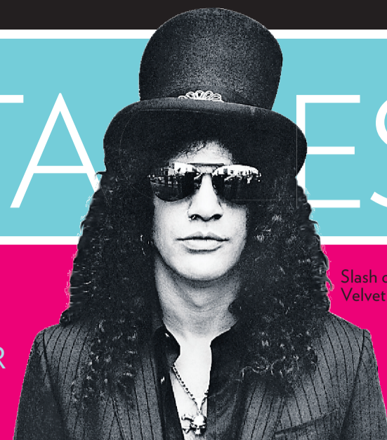
Slash du groupe Velvet Revolver

MODE JOHN VARVATOS CŒUR DE ROCKEUR PAGE 8