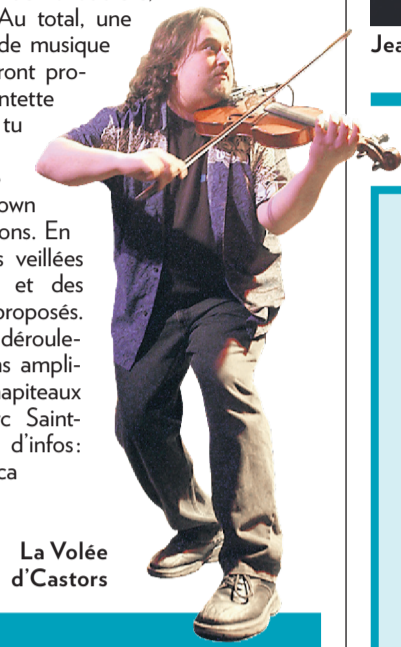
La Volée d'Castors