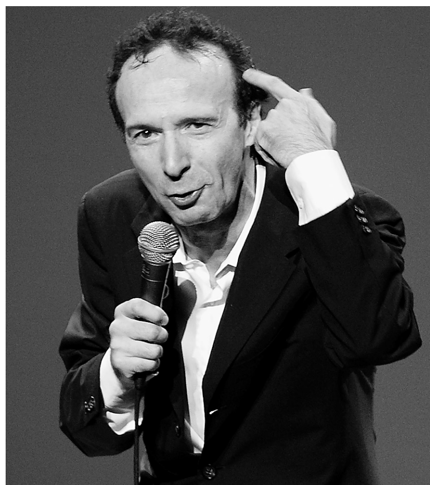
Le regard allumé et le geste vif, l'humoriste et réalisateur italien oscarisé Roberto Benigni était sur la scène du théâtre Saint-Denis hier soir.

« Le vrai amour n'est jamais perdu », a clamé Benigni, à la fin d'un parallèle entre la Francesca de la Divine comédie et une parabole du Nouveau Testament. Une pluie d'applaudissements a interrompu son cours magistral. Même quand il est sérieux, Roberto Benigni, l'éternel adolescent romantique, conquiert nos cœurs.