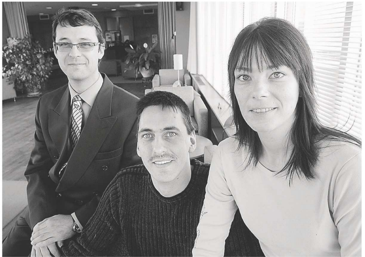
IMACOM, RENÉ MARQUIS

Aux États-Unis, on détecte cette maladie vers l'âge de trois ans. Ici, on la décèle malheureusement plus tard.