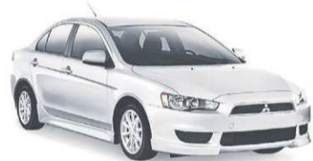
Modèle Lancer SE illustré 1

LES VÉHICULES LES MIEUX PROTÉGÉS AU MONDE* Vous voulez en savoir plus? Veuillez visiter mitsubishi-motors.ca