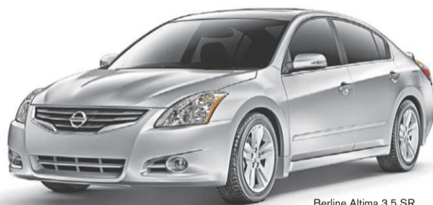
Berline Altima 3.5 SR 2012 illustrée

Sur un grand choix de modèles 2012 et sur les 2011 sélectionnés en stock