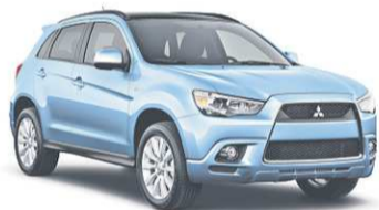
Modèle RVR GT illustré 1

60 MOIS SUR LA PLUPART DES MODÈLES LANCER 2011 1