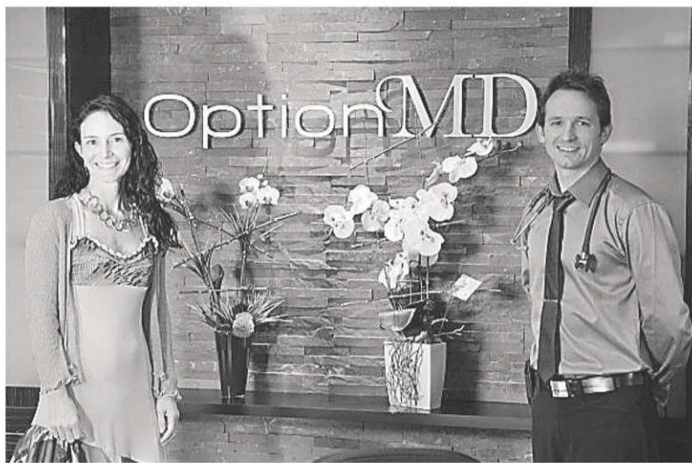
LA TRIBUNE, YANICK POISSON

Bien que ce ne soit pas essentiel afin d'obtenir les services de Dre Couture, il est possible de devenir membre d'Option MD de façon individuelle pour 500 $ par année, alors que les familles devront déboursier 1000 $. Cette carte de membre a pour effet de réduire de 25 $ le coût de la consultation et d'assurer un rendez-vous en moins de 48 heures. Au