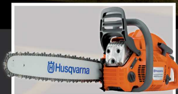
Scies à chaîne Husqvarna