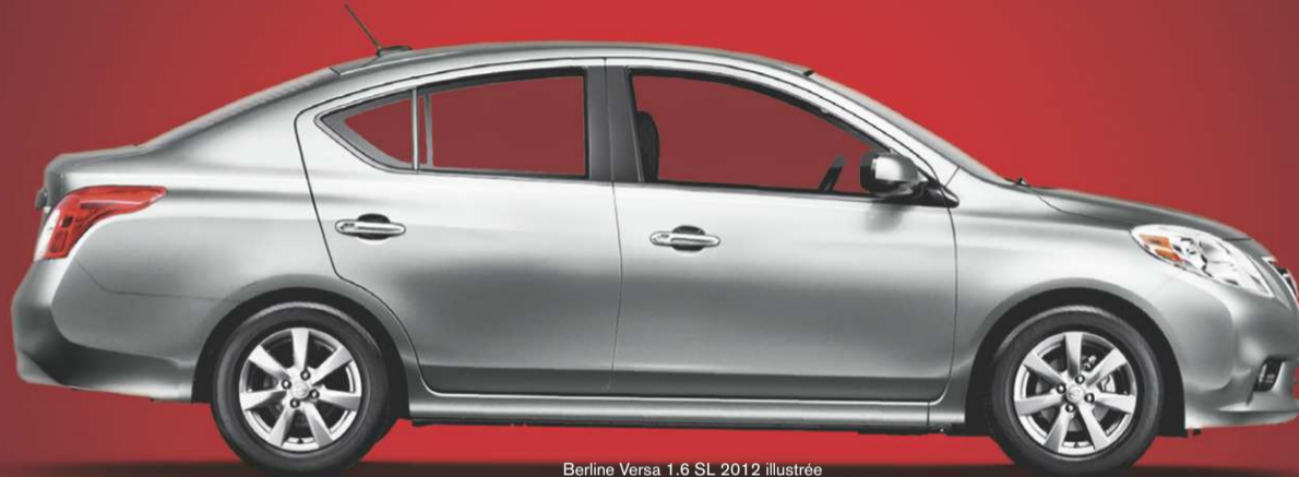
Berline Versa 1.6 SL 2012 illustrée

LE PDSF DE BASE LE PLUS BAS AU CANADA 4 .