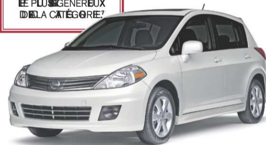
Versa à hayon 1.8 SL 2012 illustrée

L'ESPACE AUX JAMBES À L'ARRIÈRE LE PLUS GÉNÉREUX DE LA CATÉGORIE 5