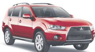
Modèle Outlander XLS illustré 1

MEILLEURE ÉCONOMIE D'ESSENCE DE LA CATÉGORIE*