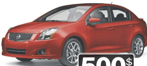
Sentra SE-R 2012 illustrée

CONSOMMATION/100 KM 6 EN VILLE : 8,8 L; SUR ROUTE : 6,2 L