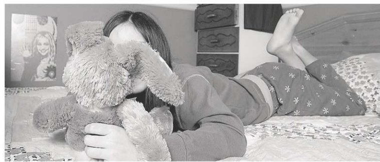
ARCHIVES LA TRIBUNE

Si les parents vivent ces émotions de façon très différente l'un de l'autre, il est possible que la situation crée des conflits ou un éloignement entre eux. Et même lorsqu'ils