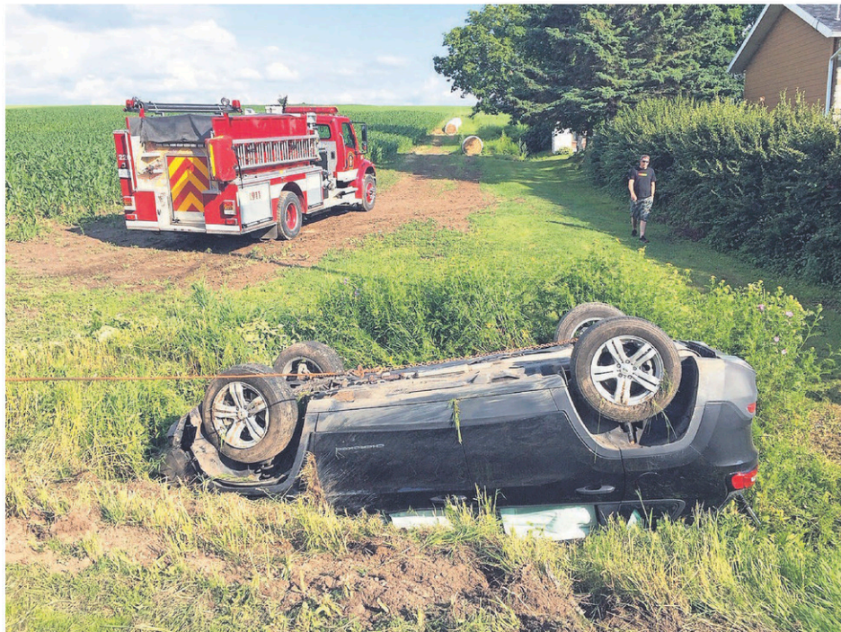
La voiture s'est finalement retrouvée à la renverse.

Seul occupant du véhicule, l'automobiliste n'a finalement subi que des blessures légères, malgré la frousse qu'a dû lui procurer l'accident.