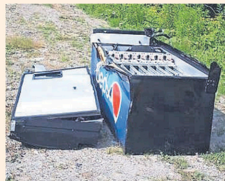
La distributrice a été retrouvée démembrée le dimanche.

« Il l'a retrouvée complètement démolie sur sa terre à bois. Ça représente environ 200$. C'est se donner du mal pour pas grand-chose, juste pour mal faire. Ce ne sont sûrement pas des jeunes puisqu'il fallait un pick-up pour la transporter et