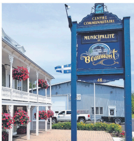
La municipalité de Beaumont a un nouveau directeur général.

S'étant jointe à la municipalité de Beaumont