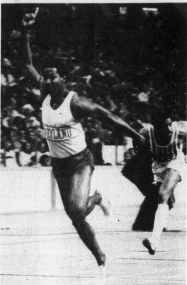
Renaldo Nehemiah, un athlète de 19 ans de l'Université du Maryland, a réalisé, à Edmonton, samedi, son cinquième record du monde de la saison 1979 d'athlétisme en salle. Nehemiah a retranscrit un dixième de seconde à sa propre marque, établie la veille, à Toronto.

D'autre part, en finale du tournoi de tennis féminin de Chicago, doté de $200,000 de prix, Martina Navratilova a battu Tracy Austin 6-3 6-4, hier.