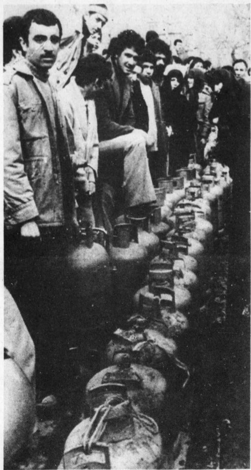
Les habitants de Téhéran ont formé hier de longues queues d'attente pour obtenir du gaz naturel nécessaire au chauffage et à la cuisine. Très rare les dernières semaines, l'approvisionnement s'est amélioré hier dans les quartiers ouest de la capitale iranienne.