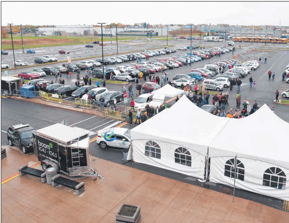
La première édition de l'événement avait attiré 200 voitures malgré le mauvais temps.

Au lieu de miser sur une journée d'automne qui s'était avérée pluvieuse, le comité organisateur a plutôt décidé d'y