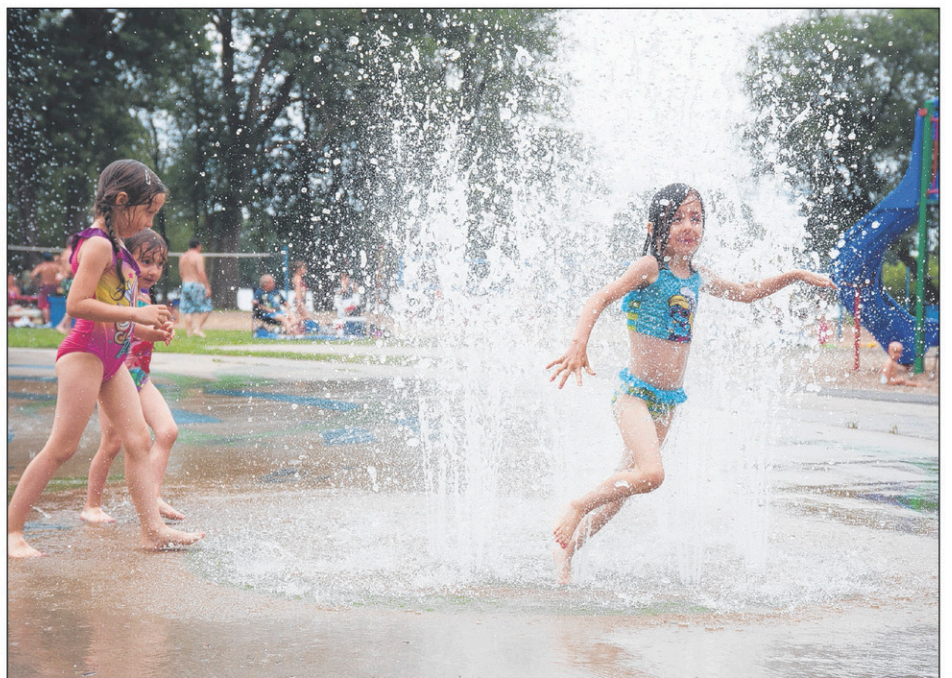
Les jeux d'eau sont toujours appréciés des jeunes et moins jeunes. Tout l'été, les familles peuvent en profiter au Centre-de-plein-air-Ronald-Beaugard (notre photo), de même qu'aux parcs Joie-de-Vivre, Notre-Dame-de-Lourdes et Alphonse-Lorrain.