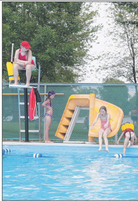
Les piscines municipales extérieures sont ouvertes officiellement depuis le 24 juin. Tout l'été, les nageurs y sont attendus de 13 heures à 19h25. Les sauveteurs sont toujours sur place pour veiller au bien-être des baigneurs.