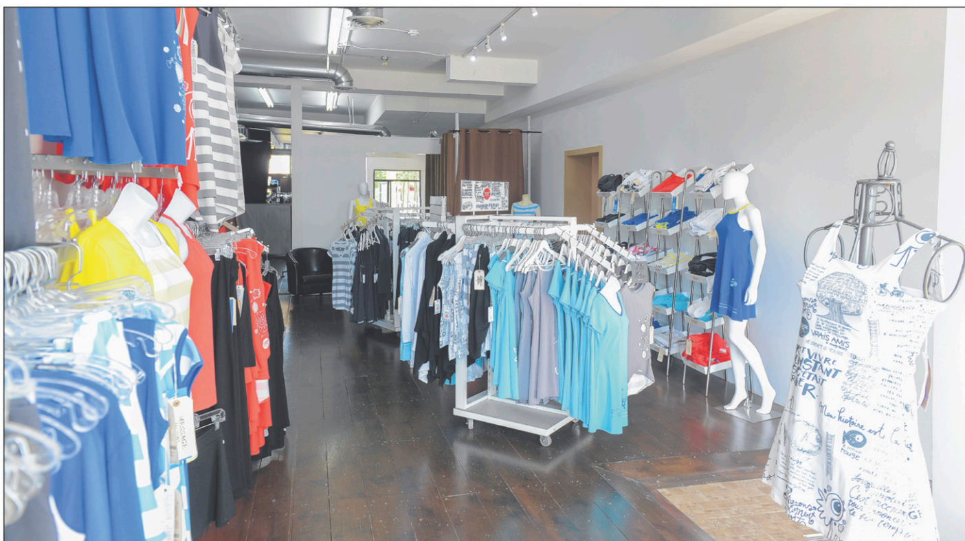
Les collections de Message Factory sont de plus en plus populaires, comme en font foi les ventes qui ont dépassé le million de dollars l'an dernier.