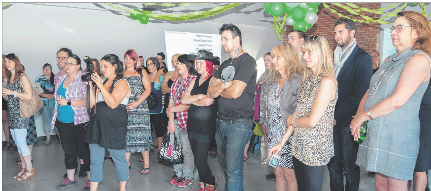
Environ 70 personnes ont assisté au gala de l'Autre école, le 18 juin dernier, au Carrefour jeunesse-emploi.

«Le système d'éducation essaye de faire entrer les jeunes dans des petites cases, mais ça ne marche pas toujours comme ça, soutient-elle. Je veux saluer votre courage et votre détermination, parce que