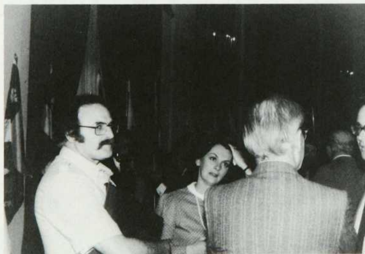
On discute en assemblée plénière et en petits groupes.