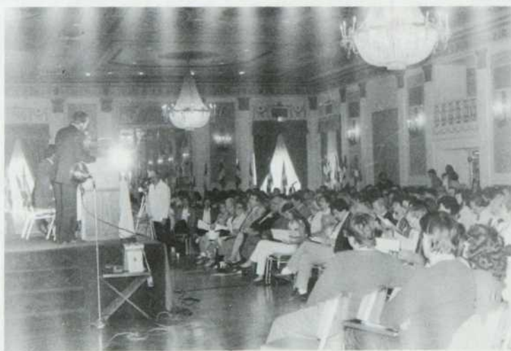
Deux coups d'œil sur l'assemblée des 600 délégués.