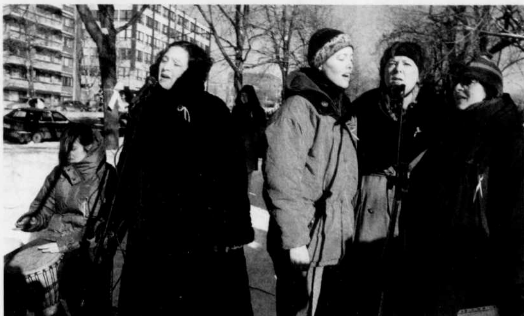
Dans les années 1980, les femmes sont convaincues que l'avenir leur appartient et plusieurs sont admises à l'École polytechnique. Ci-dessus: commémoration de la tuerie de 1989, il y a deux ans.

Les femmes se rendent alors compte que les timides avancées des générations précédentes sont loin d'avoir rempli leurs promesses: la militance est de nouveau nécessaire. De nouvelles associations féministes apparaissent durant les années 1960: la Voix des femmes, la Fédération des femmes du Québec, l'AFEAS, en plein milieu de la Révolution tranquille. Mais cette action politique reste invisible. [...] Au cours des années