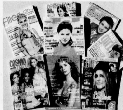
Le «backlash» se manifeste, entre autres, par une presse féminine inféodée aux publicitaires.

Si l'antiféminisme a été moins audible dans la société durant les années 1970, il resurgit de plus belle après le référendum de 1980. L'épisode des «Yvette» a incité les médias à convaincre la population que les «Yvette» rejetaient, en même temps que la souveraineté nationale, «le féminisme jugé radical et sectaire de Lise Payette». On s'est mis à