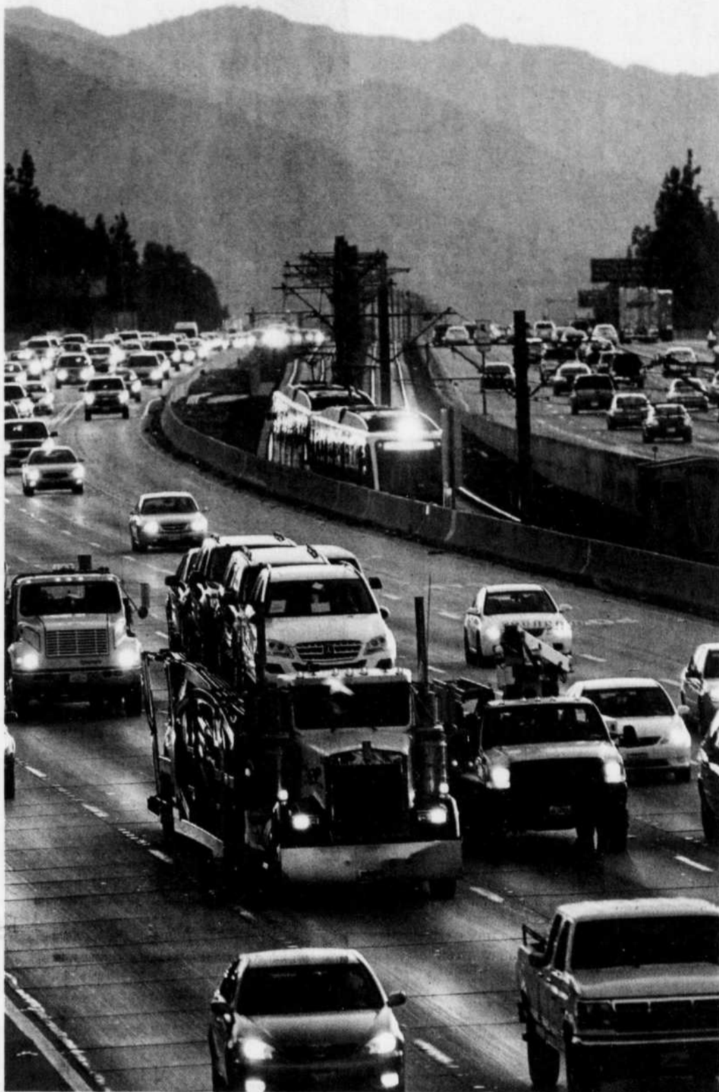
De l'avis des experts, la cible fixée par Barack Obama est modeste.

Les États-Unis sont donc nettement moins ambitieux que l'Union européenne et le Japon. L'Europe propose une réduction d'au moins 20 % et le Japon, une baisse de 25 % par rapport à 1990. Par ailleurs, plusieurs organisations scientifiques appellent les États-Unis, comme les autres pays industrialisés, à réduire leurs