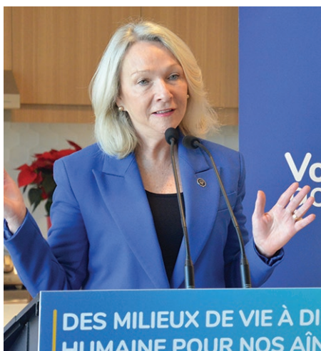
Sonia Bélanger, ministre responsable des Aînés et députée de Prévost.

La Maison des Aînés de Prévost compte 48 places, réparties en 4 maisonnées de 12 places. Chaque maisonnée est un milieu