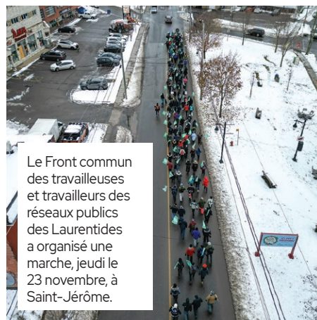
Le Front commun des travailleuses et travailleurs des réseaux publics des Laurentides a organisé une marche, jeudi le 23 novembre, à Saint-Jérôme.