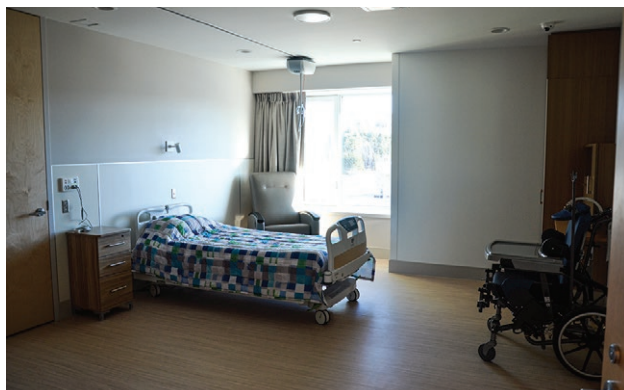
Chambres spacieuses avec salle de bain individuelle avec douche.