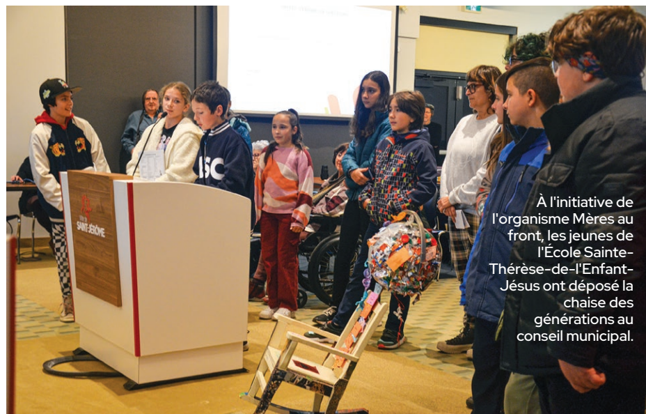
À l'initiative de l'organisme Mères au front, les jeunes de l'École Sainte-Thérèse-de-l'Enfant-Jésus ont déposé la chaise des générations au conseil municipal.

« Ce plan compte des réflexions et des analyses de différentes parties prenantes, dont font partie les citoyens, les organismes et les entreprises de Saint-Jérôme. Il permettra à la Ville de mieux orienter ses actions au cours des prochaines années », a souligné le conseiller Raymond. Il ajoute que grâce à ce plan, Saint-Jérôme se donne les moyens de préserver les milieux naturels