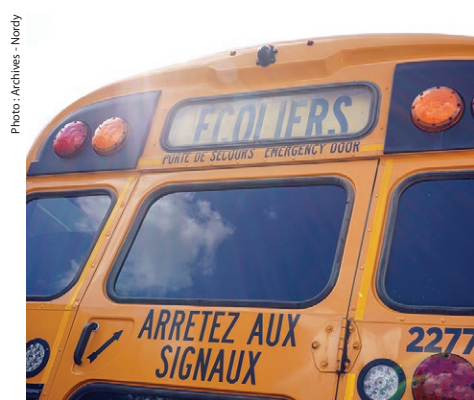
Des élèves sont demeurés coincés à l'École polyvalente de Saint-Jérôme le 7 novembre dernier.

« Désolée pour la montée de lait, mais recevoir un courriel d'annulation du circuit à 16 h 38, pour un départ à 16 h 40... c'est inacceptable ! Je comprends qu'il y ait une pénurie de chauffeurs, mais il y a des limites. Je ne vois aucune prévoyance des autorités ! On reçoit les avertissements de plus en plus tard. Comment est-on supposé s'organiser à la dernière minute, surtout quand on travaille à Montréal, lorsqu'on n'a pas de famille à Saint-Jérôme et qu'on est pris dans la circulation lourde ? », a ques-