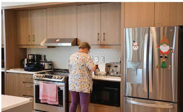
Chaque maisonnée est un milieu de vie partagé par 12 résidents, où se trouvent une cuisine, une salle à manger et un salon.