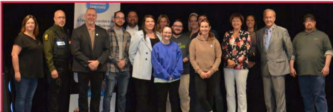
Des dignitaires du CSSPB et de la Ville de Dolbeau-Mistassini se sont joints aux membres du comité PGSF lors du lancement.