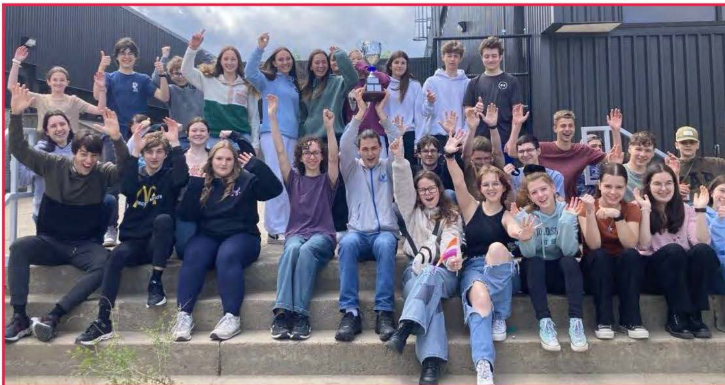
Des élèves de la Polyvalente des Quatre-Vents soulèvent la grande Coupe des Bleuets.