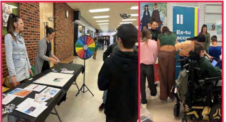
Les kiosques dans les écoles secondaires sur l'heure du dîner (à la Polyvalente de Normandin à gauche et à la Cité étudiante de Roberval à droite) ont permis de sensibiliser des centaines d'élèves sur leur utilisation des écrans.

Il s'agit donc d'un autre exemple de l'importance de conjuguer nos actions pour inspirer des passions!