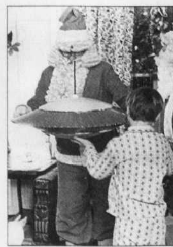
Le Martien de Noël, de Bernard Gosselin.