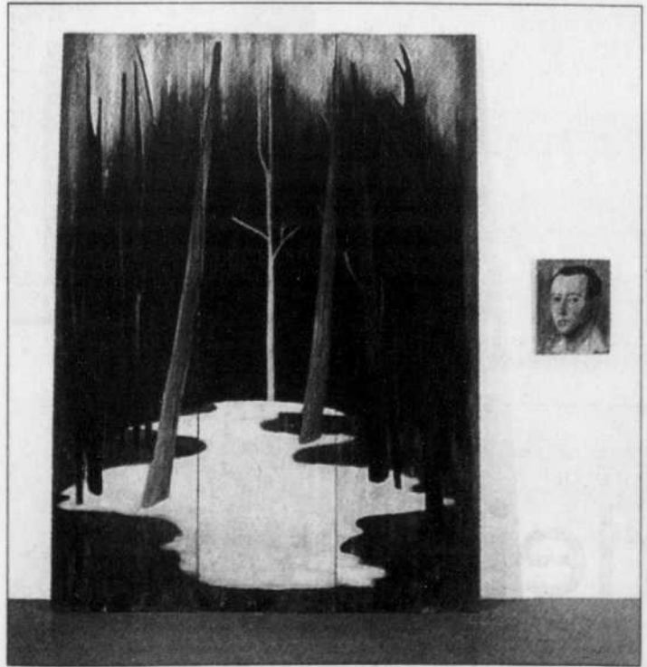
Paysage avec figure (1988), de Sylvie Bouchard.