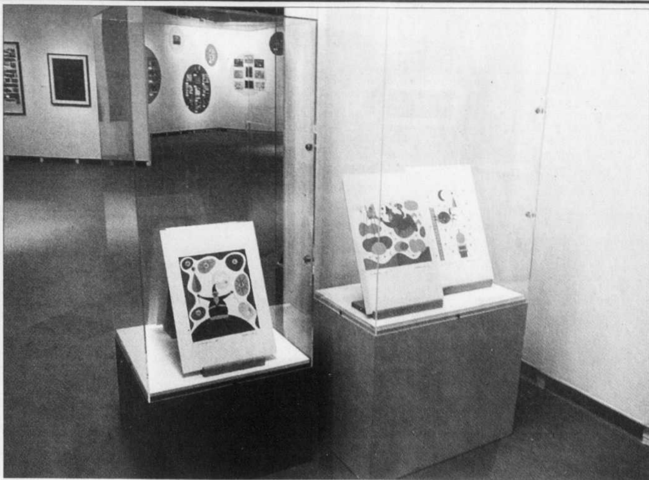
Vue de l'exposition Pellan et les enfants à la Maison des arts de Laval.