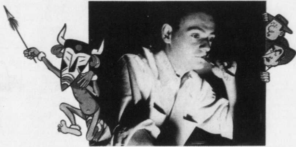
Goscinny, entouré de certains des personnages dessinés par lui...

Quelques dessins des Kurtzman et compagnie se retrouvent