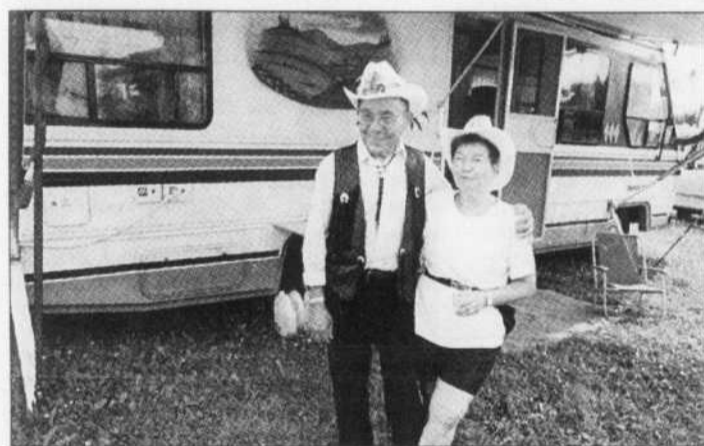
ALAIN CORNEAU ONF

Devant la roulotte, dans Country de Carole Laganière.