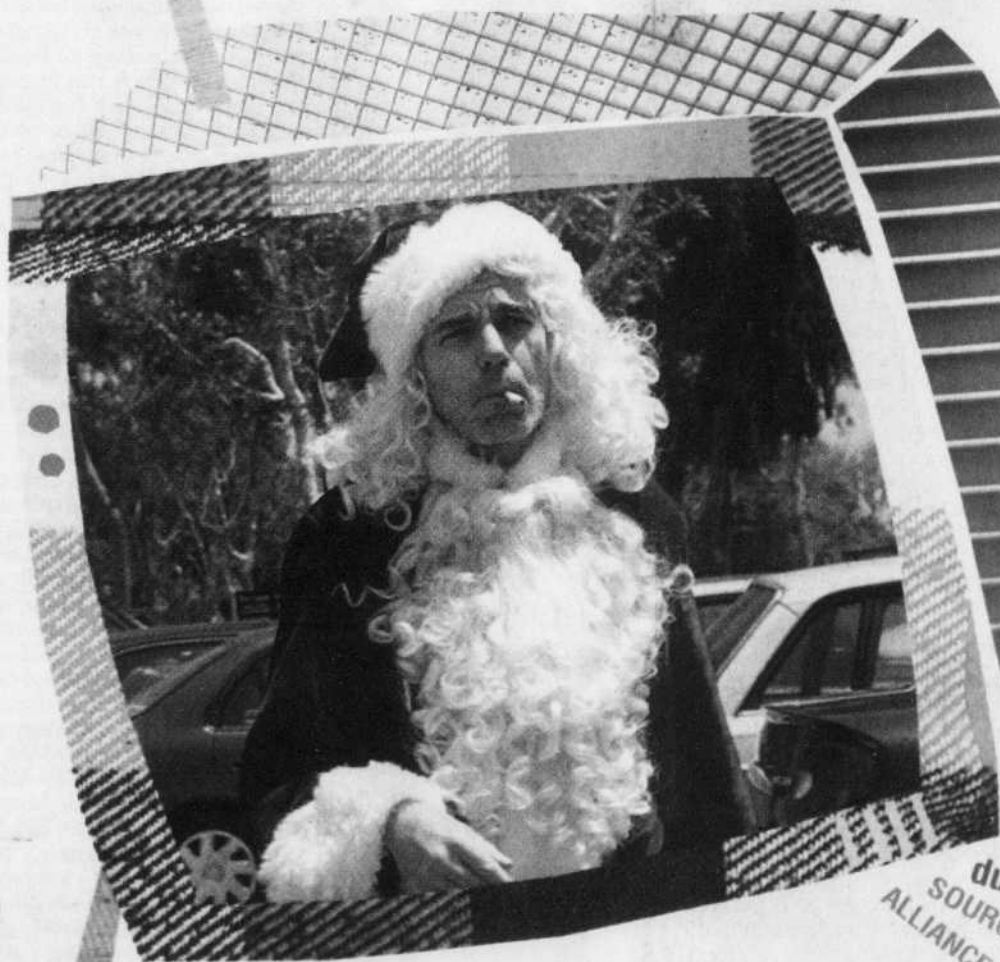
Joyeux Noël du réalisateur Christian Carion