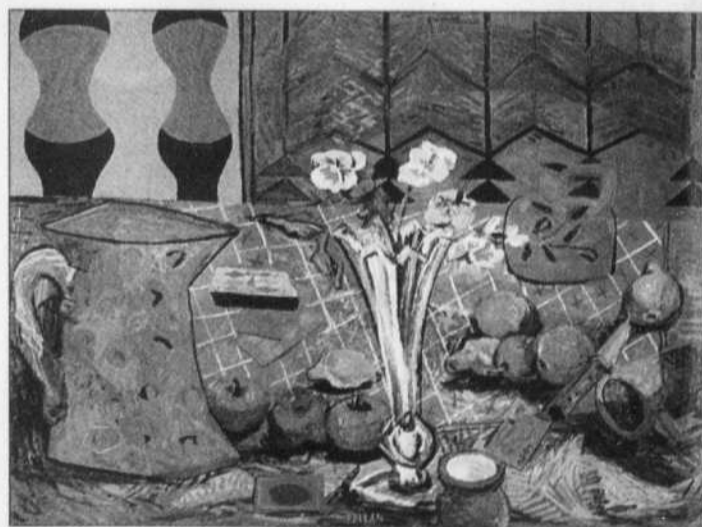
© SUCCESSION ALFRED PELLAN / SODRAC (MONTRÉAL) 2005 / MUSÉE DES BEAUX-ARTS DU CANADA Les Pensées , vers 1935-37, huile sur toile d'Alfred Pellan.