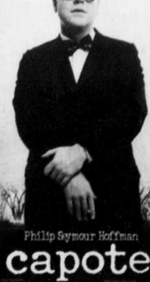
Philip Seymour Hoffman

GAGNANT CÉLÈBRE À PARIS MEILLEUR ACTEUR BENNETT MILLER