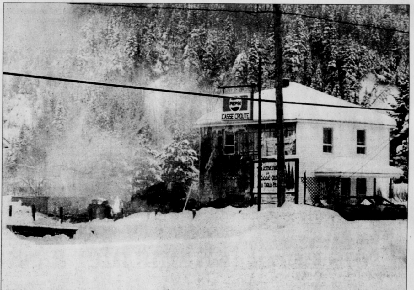
Les deux réservoirs de 400 litres de propane menaçaient d'exploser à tout moment. Le casse-croûte et la voiture sont des pertes totales tandis que le déclin de vinyle du mur extérieur de cette résidence a littéralement fondu.

À l'Association nationale des centres régionaux des propriétés forestières, on semblait toutefois peu optimiste, hier, au sujet de la délivrance accélérée de permis de travail.