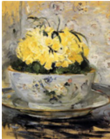
Jonquilles - Berthe Morisot 1885

Sa force et son courage : Peindre en plein air, exposer avec des artistes considérés provocateurs et marginaux, concilier vie familiale (elle se marie et a une fille) et carrière exigeante. Morisot a dû naviguer entre les attentes sociales et sa passion créatrice. Critiquée pour son « charme féminin », elle a pourtant révolutionné la peinture par sa liberté de touche. Elle incarne la détermination tranquille mais inébranlable.