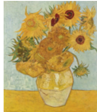
Les Tournesols, Van Gogh 1888

Dans un monde artistique dominé par un petit cercle d'hommes, ces trois artistes ont su imposer leur regard unique et leur talent. Mary Cassatt, Berthe Morisot et Marianne North ont chacune apporté une sensibilité, une maîtrise et une audace qui enrichissent durablement l'histoire de l'art. Au-delà des grands noms comme Monet, Van Gogh ou Renoir, leurs œuvres nous rappellent que la détermination permet de laisser une trace durable malgré les obstacles de son époque.