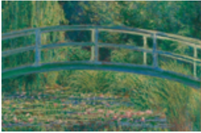
Le bassin aux Nymphéas - Claude Monet 1899

Qui ne connaît pas les Nénuphars de Claude Monet, les Tournesols de Vincent Van Gogh ou les Pivoines d'Auguste Renoir, ces chefs-d'œuvre masculins qui dominent musées et livres d'art du monde entier. Mais connaissez-vous Mary Cassatt, Berthe Morrirot et Marianne North, trois femmes peintres qui ont produit des tableaux tout aussi magnifiques, tout en affrontant des obstacles de leur époque, dans un monde qui réservait l'art aux hommes? Dans cette chronique, je fais lumière sur ces femmes peintres talentueuses souvent éclipsées par les grands noms masculins de l'impressionnisme et de l'art du 19ème siècle.