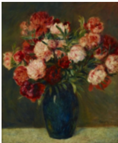
Les Pivoines, Renoir 1880

Allez les admirer au musée ou en ligne : leurs toiles méritent largement leur place sous les projecteurs.