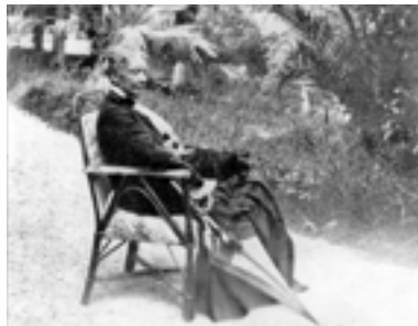
Photo de Mary Cassatt

féministe avant l'heure, refuse très tôt le destin traditionnel réservé aux femmes de son époque. Célibataire convaincue, elle rejette le mariage pour se consacrer entièrement à la peinture. Après un long périple en Europe pour étudier les maîtres dans les grands musées, elle s'installe à Paris et devient la seule Américaine à exposer avec les Impressionnistes. Proche de Degas, elle participe à quatre des huit expositions du groupe. Dans un milieu artistique profondément masculin, elle impose son indépendance. Militante discrète pour le suffrage féminin, elle voit plusieurs de ses œuvres, dont Femme au Tournesol, exposées en 1915 lors d'une grande vente au profit de la campagne pour le droit de vote des femmes aux États-Unis.