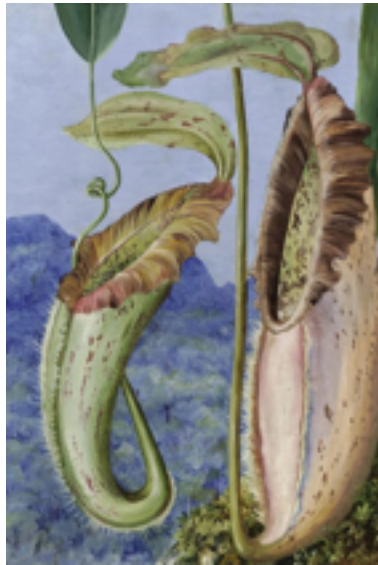
Nepenthes northiana – Marianne North 1876 huile sur panneau

siècle, affronter jungles, maladies tropicales, tremblements de terre et bateaux précaires. Marianne North a brisé toutes les barrières. Sans formation académique formelle, elle gagne le respect de scientifiques comme Charles Darwin. Elle a découvert plusieurs plantes inconnues de la science, dont une plante carnivore à Bornéo ( Nepenthes northiana ) nommée en son honneur.