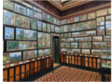
Gallerie Marianne North, Royal Botanical Garden Kew, Londres.

Elle a non seulement peint, mais aussi collecté des informations détaillées sur l'habitat et les usages des espèces. Elle a tout fait pour assurer son immortalité artistique en créant elle-même son legs monumental.