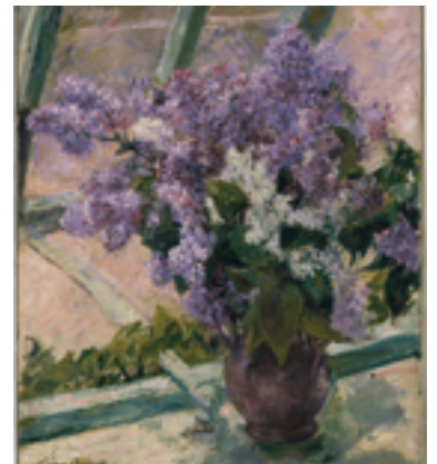
Vase de lilas à la fenêtre - Mary Cassatt 1880