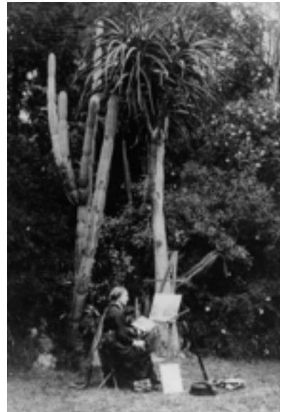
Photo de Marianne North

Très différente des deux impressionnistes parisiennes précédentes, Marianne North est une exploratrice britannique hors norme. Issue d'une famille aisée, elle perd sa mère jeune puis son père.