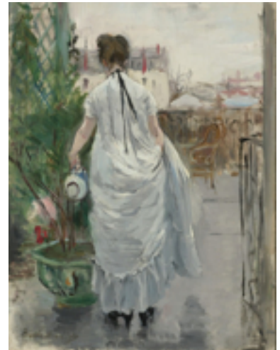
Jeune Femme arrosant un arbuste, Berthe Morisot 1876

Très différente des deux impressionnistes parisiennes précédentes, Marianne North est une exploratrice britannique hors norme. Issue d'une famille aisée, elle perd sa mère jeune puis son père.