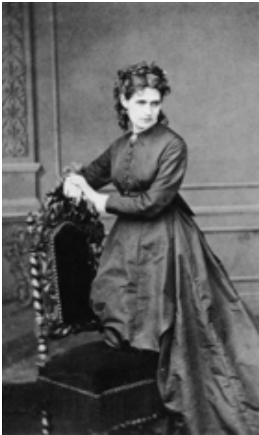
Photo de Berthe Morisot

Berthe Morisot est une des figures centrales du mouvement impressionniste. Issue d'une famille bourgeoise française, elle étudie la peinture malgré les conventions et devient amie, puis belle-sœur d'Édouard Manet. Elle participe à la première exposition impressionniste en 1874 et à presque toutes les suivantes – souvent la seule femme du groupe.