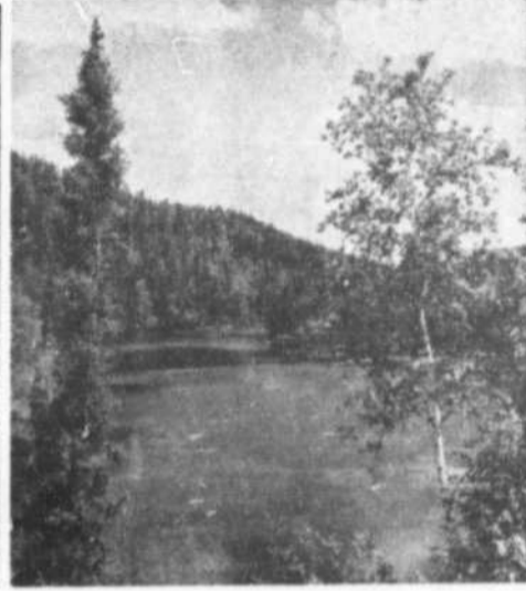
LES PHOTOGRAPHIES GAGNANTES du concours organisé récemment parmi les membres de la Section forestière de l'Association canadienne des pâtes et papiers, montrent de façon saisissante le venue du printemps dans les forêts. En haut, "Couloir de flottage", par Paul E. Lambert, de l'Anglo-Canadian Pulp and Paper Mills, Ltd., Forestville (P.Q.); en bas à gauche, "L'Éveil du printemps", par H. S. D. Swan, Institut de Recherche des pâtes et papiers du Canada, Pointe-Claire (P.Q.); et en bas à droite, "Eau lente", par J. L. Jorgensen, Canadian International Paper Co., Trois-Rivières (P.Q.).

et dont la valeur atteint un milliard et demi de dollars chaque année.