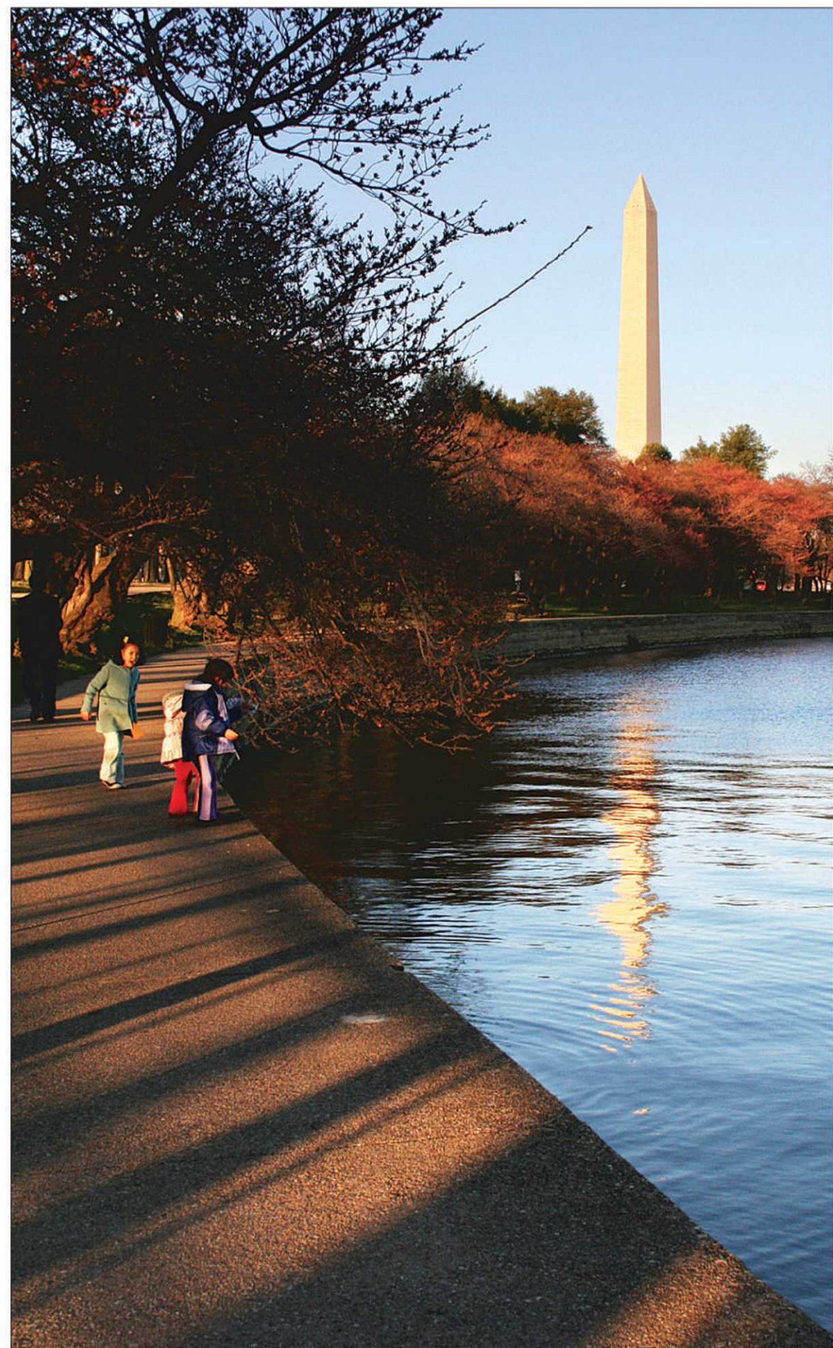
Le Mall est une grande esplanade bordée de monuments et musées, du Capitole au Washington Monument.

Les touristes à pied avancent bien lentement en comparaison. Beaucoup nous demandent avec