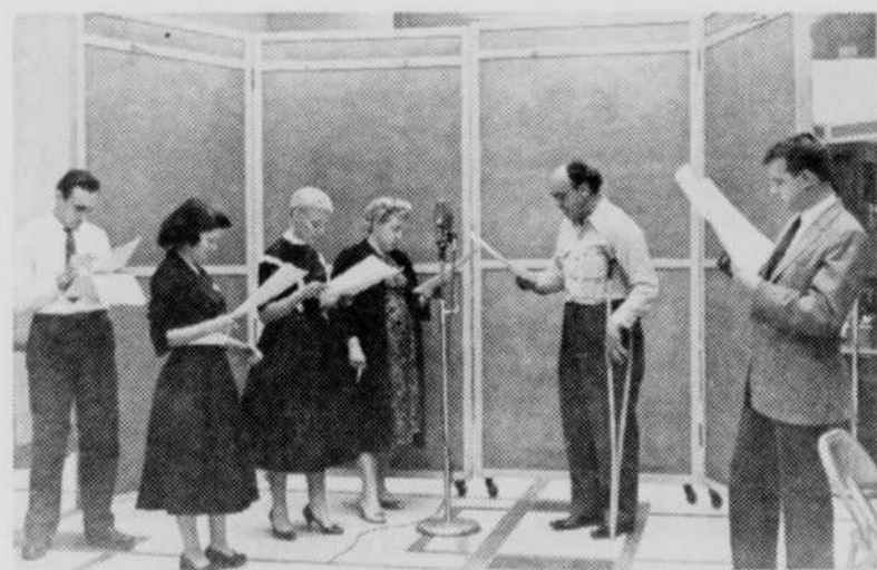
"Je vous ai tant aimé"