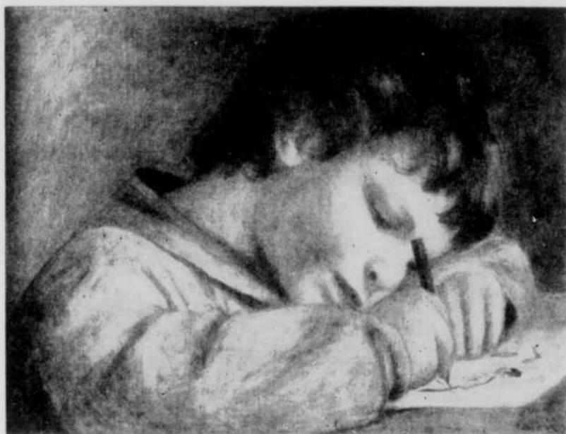
"Le premier essai" (Auguste Renoir)

Les concurrents seront classés en deux groupes; le premier comprendra les jeunes de douze à quinze ans et le second ceux de quinze à vingt ans. La division des concurrents en deux catégories, au point de vue âge, permettra de rendre justice aux plus jeunes, qui n'auront pas ainsi à se mesurer avec des plus âgés.