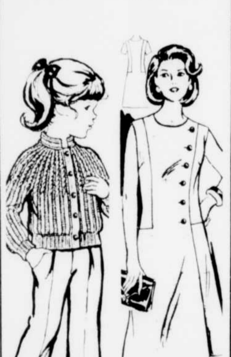
822 Laura Wheeler, 4860 Anne Adams

"TRICOTÉE DU COU AU BAS" -822 "TRÈS AMINCISSANT!" -4860