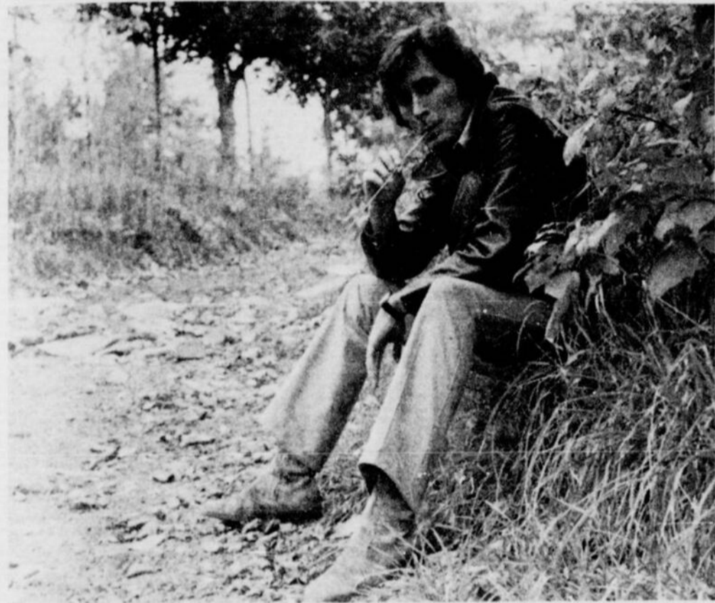
Avant il travaillait pour l'argent maintenant c'est secondaire: il a trouvé sa place définitive, le cinéma... et la liberté.

— Avant, je travaillais pour l'argent, maintenant l'argent c'est secondaire. C'est secondaire depuis que je fais ce que j'aime. Depuis que ma vie est un hobby, ajoute-t-il, avec un sourire de satisfaction.