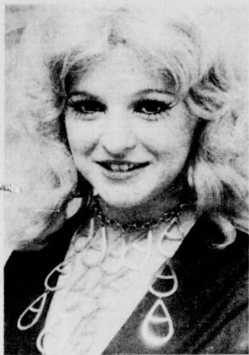
ELOISE ... renouveau