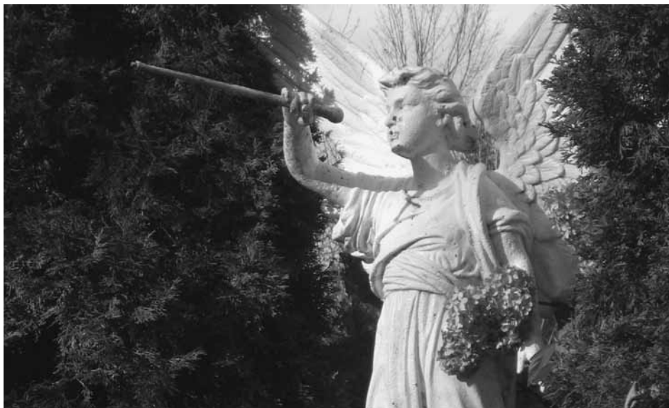
L'ange de la résurrection, cimetière Saint-Thomas-d'Aquin II Photographie : Jeanmarc Lachance 2010