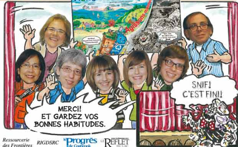
Illustration : Connie Marcoux Histoire : Monique Clément, Sabrina et Noémie Caron, Bastien Daoust-Beaudin, Sonia Montminy, Jean-Claude Daoust.

MEMPHREMAGOG MRC, RECYC-QUÉBEC, Ressourcerie des Frontières, RIGDSRC, Progrès de Coaticook, LE REFLET DU LAC