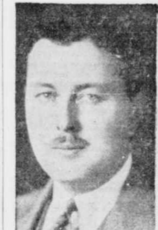
L'hon. Paul SAUVÉ

Température détaillée (laire et chaleur continue. Brouillard, ca et la, le matin. Vents légers. Minimum ce soir à Sherbrooke 53. Maximum demain 58. (Le mercure a monté à 85 hier, à Sherbrooke, soit à 3 degrés du record de 1942 pour un 18 septembre.)