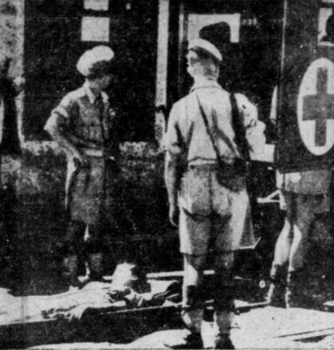
Si près du bul rêvé — Voici la photo d'une fillette juive tirée des "navires d'enfer" qui tentent de transporter illégalement en Palestine des réfugiés d'Europe. La fillette, sur une civière, est transportée à une ambulance qui la mènera à l'hôpital de Chypre en attendant son rétablissement et son internement. Le fillet naval des Britanniques ne laisse pas passer d'immigrants en Palestine, tant que l'état civil de chacun n'est pas bien établi. En attendant, tous sont dirigés vers Chypre et des camps de détention.

Les débris furent découverts par un avion de reconnaissance mais on ne sait pas encore s'il existe des survivants. L'avion a lâché tomber des secours près du gros transport, une équipe de sauveteurs est partie à travers bois vers l'endroit de l'accident.