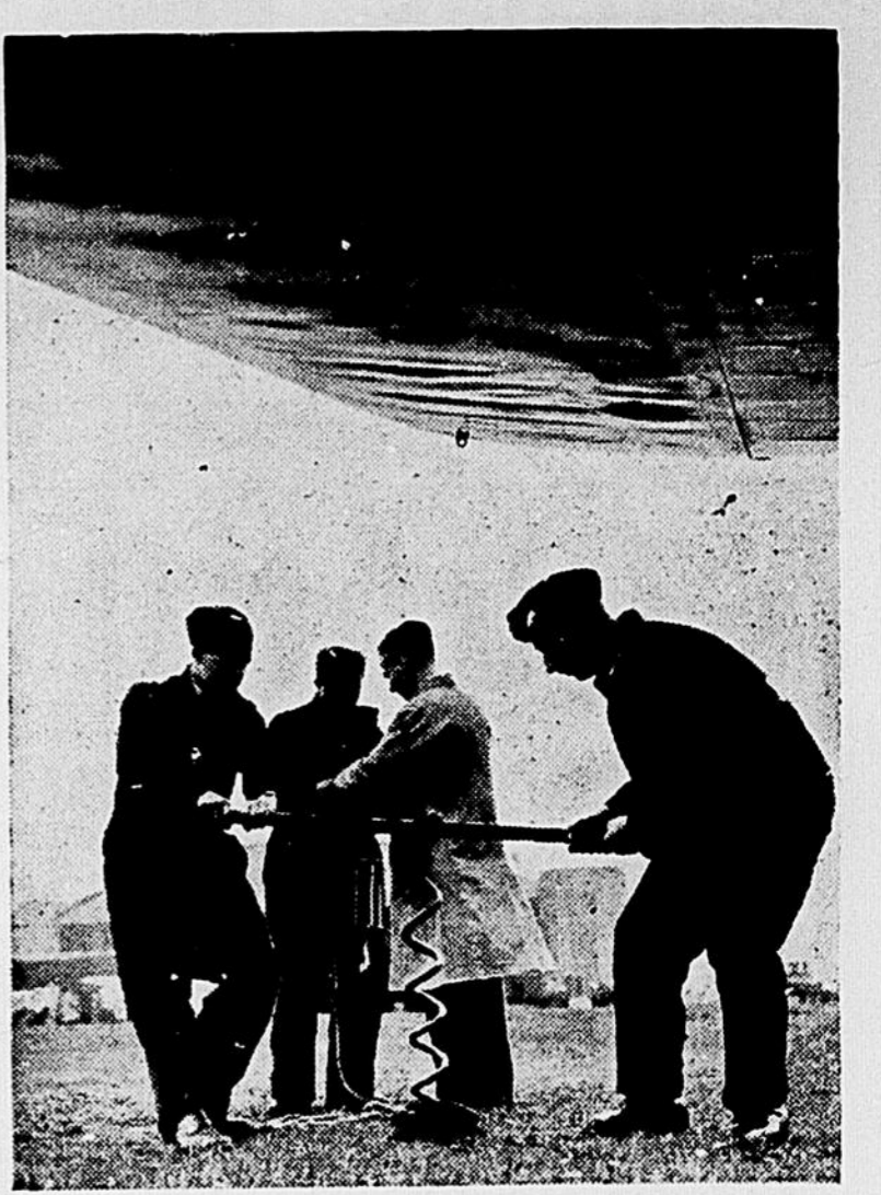
Il faut à tout mécanicien dans l'aviation un entraînement de quelques semaines avant de savoir comment tourner l'hélice d'un gros bombardier au départ de l'appareil. Deux mécaniciens pratiquent ici sur une spirale plantée en terre.

à prévoir et à repousser la prochaine initiative de l'ennemi, mais plus encore à surprendre l'ennemi par nos initiatives. Nous avons souvent tâche, nos ingénieurs peuvent collaborer avec nos combattants.