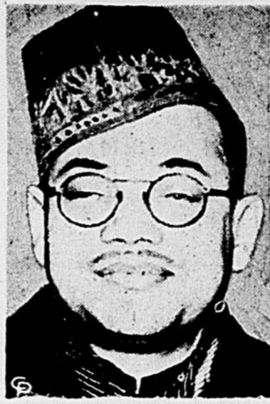
Le rival du mahatma Gandhi, dans la direction du parti nationaliste indien, Subhas Chandra Bose a été arrêté pour être venu en contravention avec la loi de défense nationale.

me en s'appliquant à viser des objectifs militaires, il est inévitable d'atteindre des femmes et des enfants, et la guerre devient alors de la barbarie.