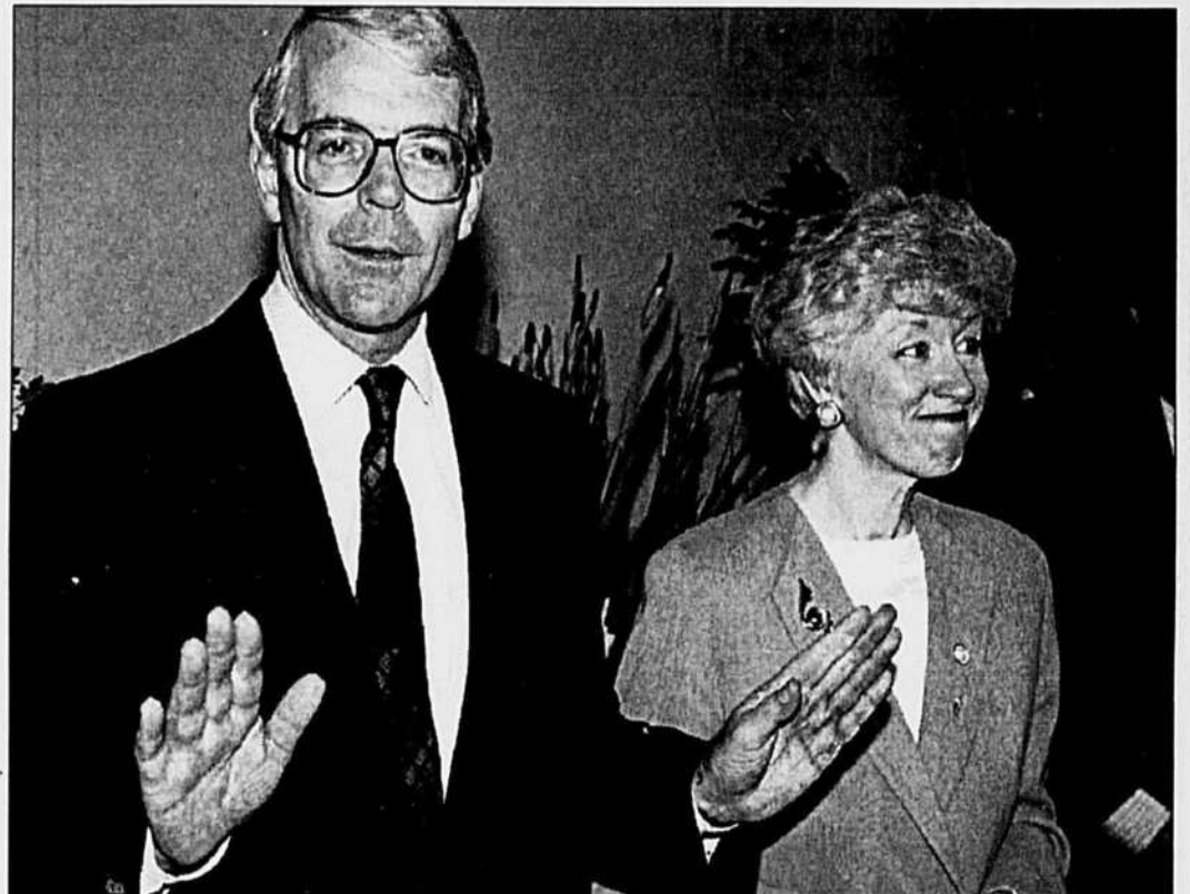
La première ministre Kim Campbell a rencontré le premier ministre britannique, John Major, dans le cadre d'une série d'entretiens précédant le sommet.

à défaut, à une simple déclaration de principe sur les négociations commerciales du GATT, indiquant hier une source diplomatique occidentale.