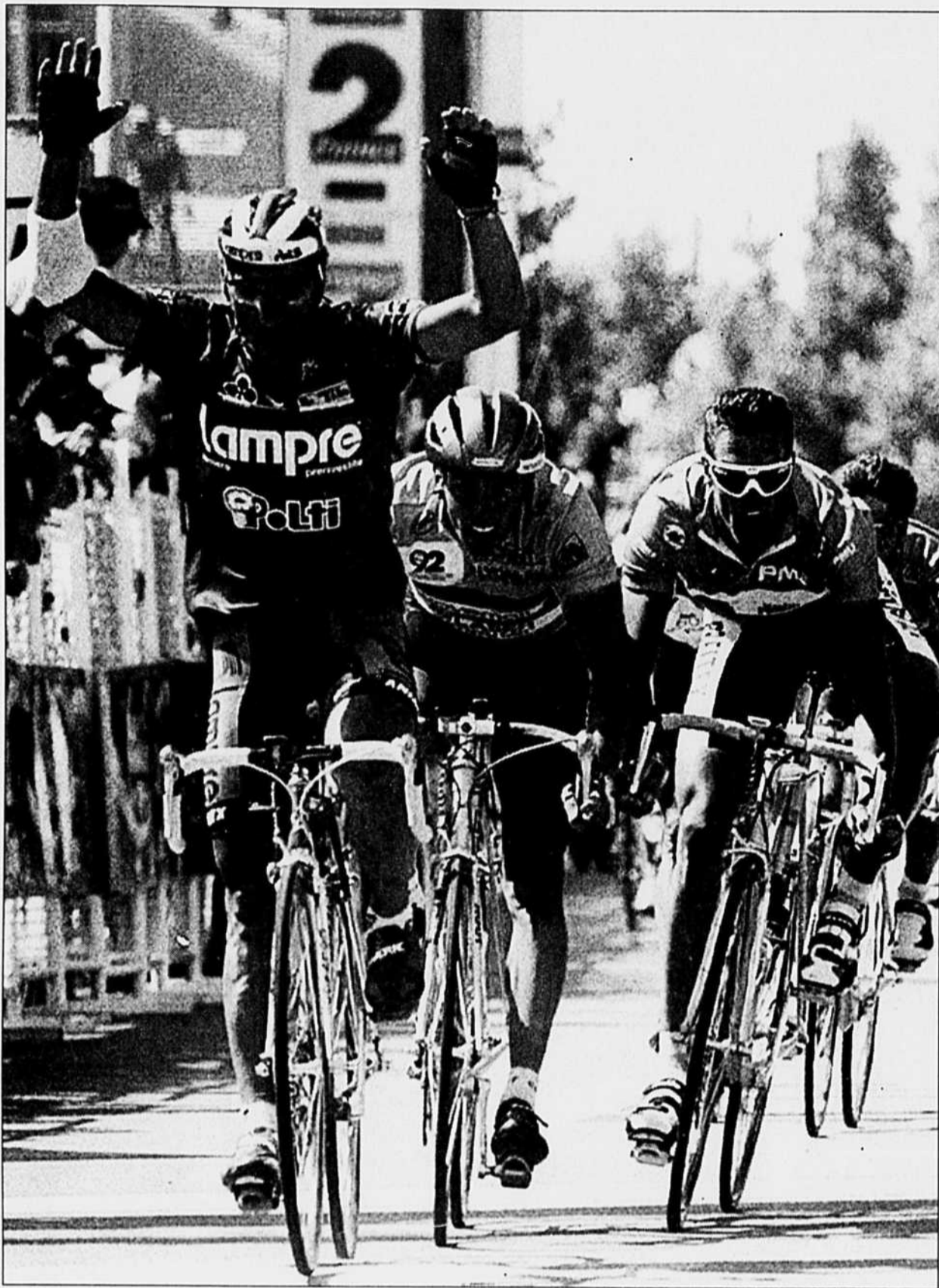
Djamolidine Abdoujaparov lève les bras en traversant la ligne d'arrivée de la troisième étape du Tour de France. Le maillot jaune Wilfried Nelissen de Belgique est second suivi de l'Italien Mario Cipollini.