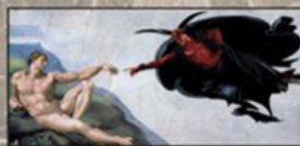
Christus Verus Lucifer