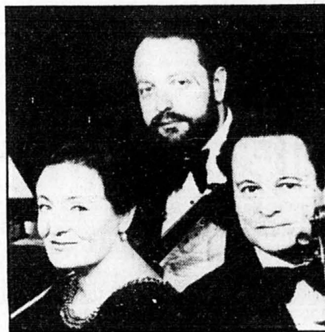
Le Trio Borodine