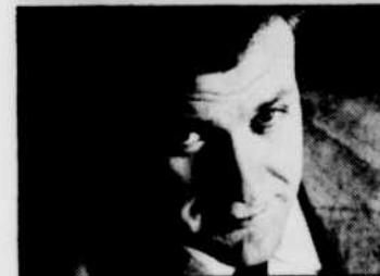
Nicole COURCEL, Jean POIRET et Pierre MONDY.