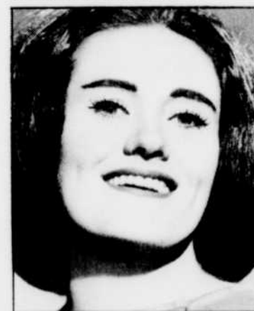
Joan SUTHERLAND, à «Opéra», samedi à 14 heures.