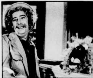
ULYSSE ET OSCAR, tous les jours à 10 h 30.

23 h 00—TÉLÉJOURNAL 23 h 20—NOUVELLES DU SPORT CBOFT—DERNIÈRE ÉDITION CBVT—ICI QUÉBEC 23 h 25—CBOFT—SPORTS *23 h 30—CINÉ-CLUB «L'Impératrice Yang Kwel Fei». Film de Kenji Mizoguchi, avec Machiko Kyo. (Japonais sous-titré). (Article en page 7). 23 h 35—CBOFT—CINÉ-CLUB «La Fleur de l'âge». Film de V. Scharmoni, avec Ulla Jacobson et Hans Dieter. Un homme de quarante ans revient, à l'occasion de Noël, visiter sa femme dont il est séparé et qui garde leurs deux enfants. Il est accompagné de sa jeune maîtresse. Il retrouve sa femme, plus ou moins amoureuse d'un vétérinaire. (Allemand sous-titré). Présentation: Jacques Fauteux. 1 h 00—CBFT—TÉLÉJOURNAL