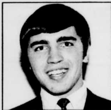
THE GLEE CLUB , groupe vocal de 33 jeunes étudiants indiens de Portage La Prairie.