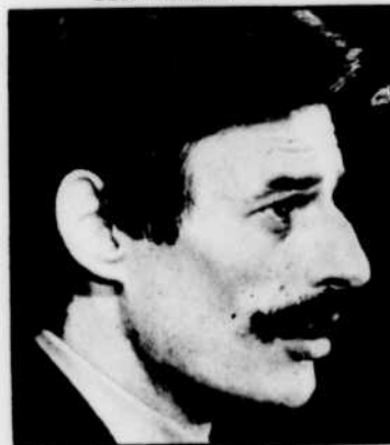
Jean FERRAT: «Avec les yeux du coeur», vendredi à 13 h 45.

CJBC—GENS DU SUD CBV—AU FIL DE LA CHANSON 17 h 00— CBF—RADIOJOURNAL CBJ—NOUVELLES LOCALES CBAF—NOUVELLES LOCALES CBOF—NOUVELLES LOCALES CJBC—NOUVELLES ONTARIENNES 17 h 05— CBF—PRÉSENT Edition métropolitaine. CBV—PRÉSENT RÉGIONAL CBJ—PRÉSENT RÉGIONAL CBOF—PRÉSENT RÉGIONAL 17 h 10— CJBC—GENS DU SUD (CAHIER ONTARIEN) CBAF—CHRONIQUE 17 h 30— PRÉSENT Edition nationale. 18 h 00— DE TOUS LES POINTS DU MONDE CBV—CARNET DES ARTS NOUVELLES DU SPORT CBOF—CHRONIQUE SPORTIVE CBAF—MUSIQUE LÉGÈRE 18 h 25— CARNET DES ARTS D'Ottawa. Actualité artistique. 18 h 40— UN INSTANT RADIO-TRANSISTOR 19 h 10— UN INSTANT DE VACANCES 19 h 50— ASTÉRIX «Astérix le Gaulois». 20 h 00— LES JEUNES ANIMATEURS 20 h 30— RADIOJOURNAL CBJ—CBC NEWS 20 h 33— LES ANGES GARDIENS De Québec. Émission s'adressant aux automobilistes-vacanciers. Musique et sketches amusants, conseils, renseignements utiles et nouvelles sur tout ce qui peut agrémente les vacances. Animateurs: Richard Joubert, Denyse Gagnon et Claude Septembre. 22 h 30— RADIOJOURNAL 22 h 50— COMMENTAIRES 22 h 55— NOUVELLES DU SPORT 23 h 00— JAZZ EN LIBERTÉ De l'Ermitage, à Montréal. Sextuor, dir. Robert Roby. Présentatrice: Colette Devlin. 23 h 25— CBAF—FIN DES ÉMISSIONS 00 h 00— RADIOJOURNAL 00 h 03— PENSÉES DE LA NUIT Avec René Salvator-Catta. 00 h 08— AU FIL DE LA NUIT De Québec. Musique variée, présentée par Vincent Joly. 1 h 00— RADIOJOURNAL 1 h 03— FIN DES ÉMISSIONS