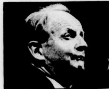
Wilhelm KEMPPFF: «Avec les yeux du cœur», jeudi à 13 h 45.