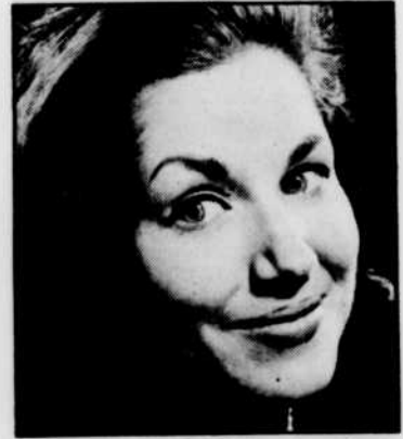
Denyse GAGNON, animatrice des «Anges gardiens», vendredi à 20 h 30.