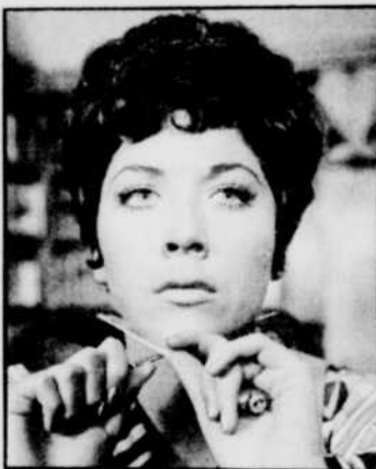
Linda THORSON , nouvelle vedette de «Chapeau melon et bottes de cuir», le mardi à 22 h 00.