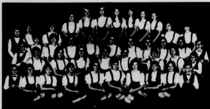
MENONITE CHILDREN'S CHOIR OF WINNIPEG , groupe 40 jeunes chanteurs et chanteuses qui se spécialisent dans le folklore international.