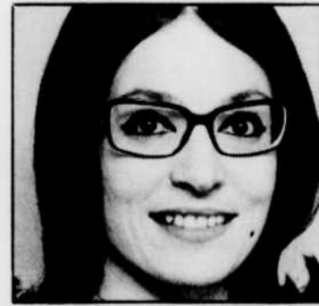
«Avec les yeux du cœur»: Nana MOUSKOURI, mercredi à 13 h 45.