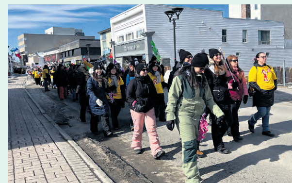
Les manifestants sont partis du centre-ville de Rimouski pour se rendre au bureau de la députée-ministre Maité Blanchette Vézina.

« Nous aimerions avoir des congés, du temps de planification et du soutien pour les enfants à besoins particuliers de plus. Nos tâches sont de plus en plus lourdes parce que nous avons de plus en plus d'enfants à be-