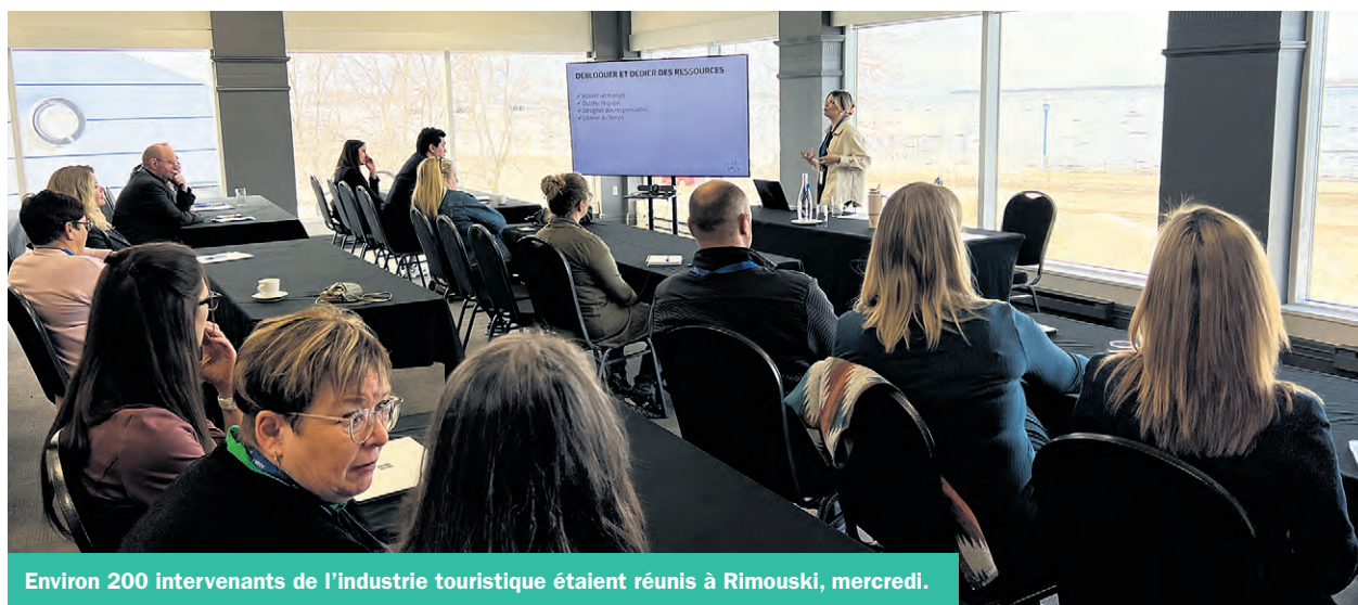
Environ 200 intervenants de l'industrie touristique étaient réunis à Rimouski, mercredi.

La guerre tarifaire avec les États-Unis pourrait être avantageuse pour l'industrie du tourisme dans la région. Selon Tourisme Bas-Saint-Laurent, plusieurs ont changé leurs projets de voyage.