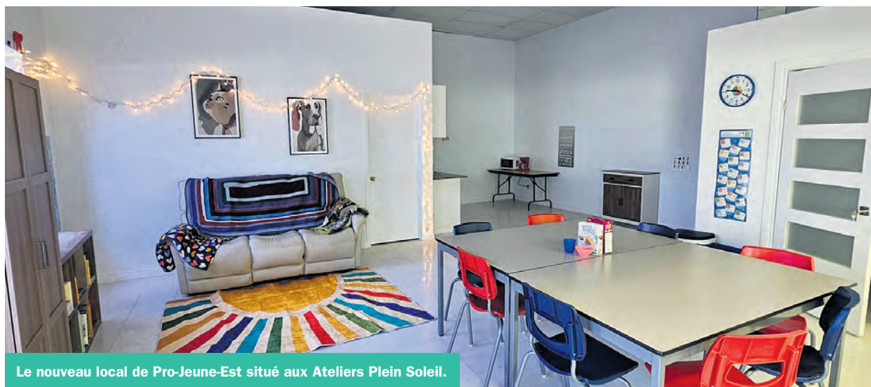
Le nouveau local de Pro-Jeune-Est situé aux Ateliers Plein Soleil.

La population sera invitée à découvrir ce nouvel espace à Mont-Joli prochainement. Les détails seront publiés sur la page Facebook « Pro-Jeune-Est ».