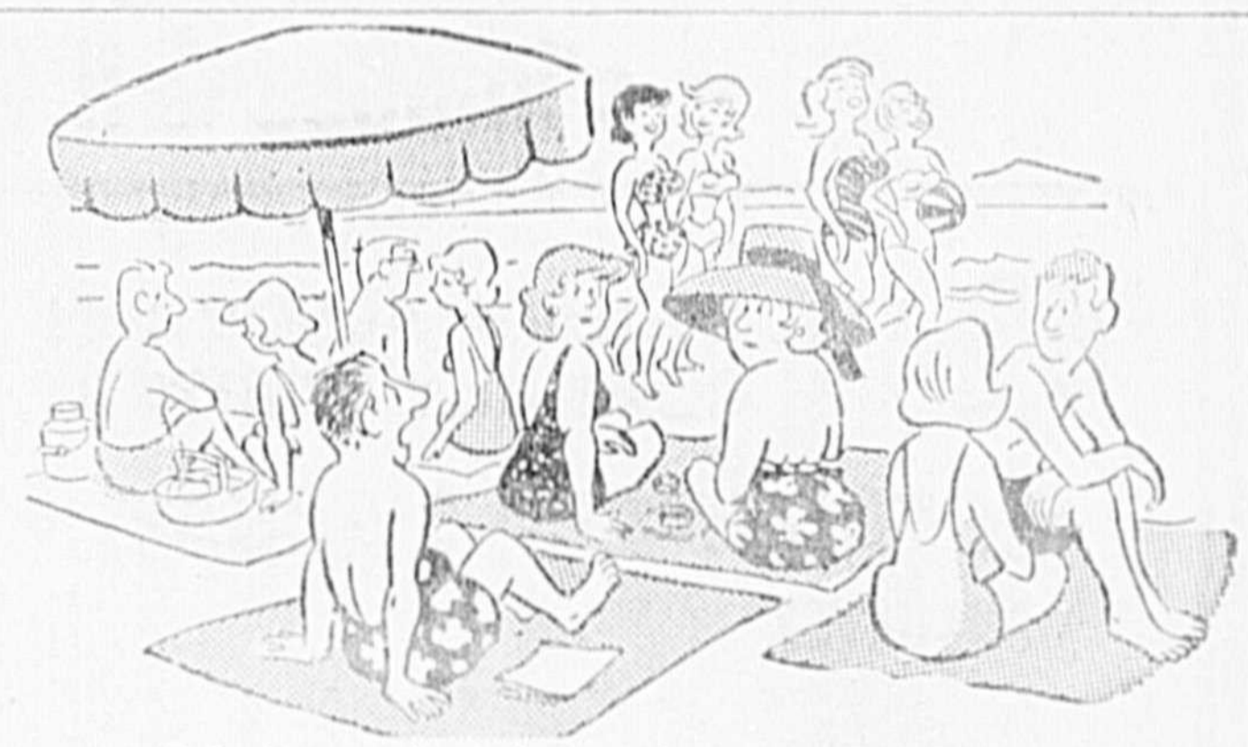
"Madame, de grâce, enlevez votre chapeau!"

Cette réunion de notre cercle est pour nous toutes, un loisir utile et agréable. N'oubliez pas la réunion mensuelle, mercredi 21 avril. Qu'on se le dise. La secrétaire