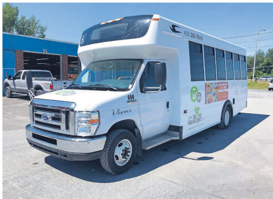
Le coût du transport adapté et collectif augmentera dès juin prochain sur le territoire de la MRC de Brome-Missisquoi.

Les usagers devront prévoir un déboursé de 3 $ pour un déplacement au sein d'une