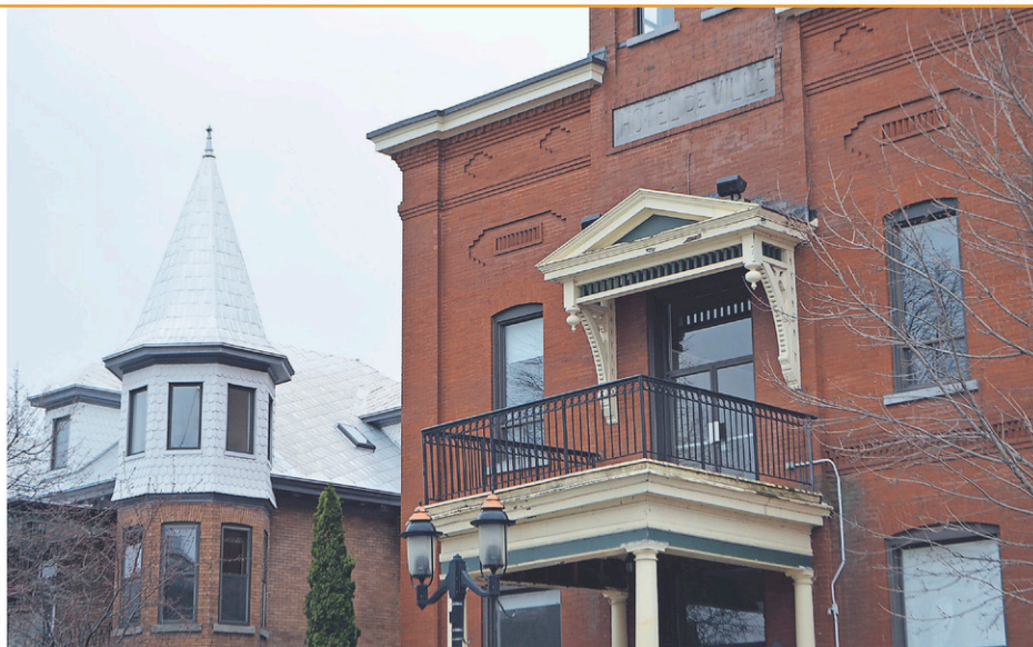
Le balcon de l'hôtel de ville sera reconstruit à neuf dans les prochains mois.

La directrice des loisirs, Roxanne Roy-Landry, précise que le tiers des usagers de l'aréna habite à l'extérieur de Farnham. Certains d'entre eux résident dans l'une des trois municipalités sous contrat avec la Ville de Farnham alors que d'autres proviennent d'une municipalité autre (Sainte-Brigide-d'Iberville par exemple). (C.H.)