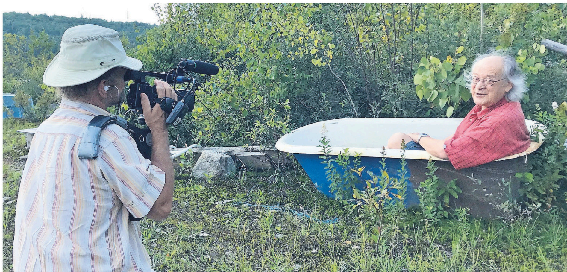
Le tournage de «Raoul Duguay par-delà la Bittt à Tibi» a nécessité une année de travail.

«Le film devrait également inclure des extraits de l'hommage rendu par un groupe d'étudiants universitaires à L'Infonie (NDLR: orchestre mythique des années 70 qui alliait la musique, l'improvisation, la danse et les arts visuels)», précise M. Langlois.