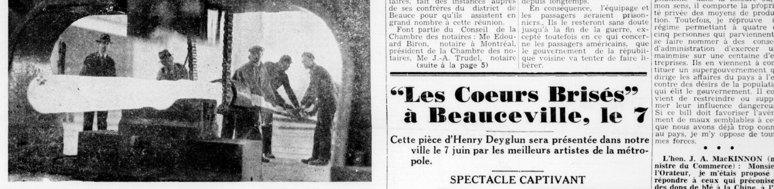
• Dix tonnes de métaux de rebut ont été jetées dans l'immense fournaise électrique d'une fabrique de canons canadienne, que l'on peut voir dans la photo ci-dessus. Au bout de trois heures, ce n'est plus que de l'acier fondu, grâce à une température de trois cents degrés Fahrenheit. Après différents procédés, le métal communique à prendre la forme d'un canon canadien. (Voir photo ci-dessous). On voit les ouvriers canadiens utilisant un marteau-pilon qui martèle et façonne le canon. Des armes de ce genre sont fabriquées en grandes quantités dans les usines canadiennes. Ce n'est là qu'une faible part de la contribution du Canada dans la guerre contre Hitler. Achetez des bons de la victoire de façon à maintenir la production toujours croissante de ces canons transportés au-delà de l'Atlantique.