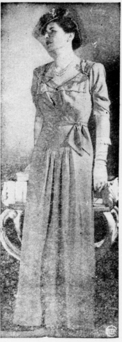
La mère de la mariée sera très élégante dans cette robe de crepe gris perle, avec des petites boucles au décolleté.