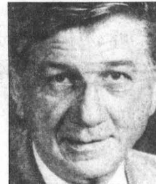
M. Erik Nielsen

« Le gouvernement ne peut pas annuler le programme car il est allé trop loin avec les soumissionnaires qui ont dépensé des millions de dollars depuis des années pour obtenir ce contrat. La perte de crédibilité serait énorme auprès des sociétés qui soumissionnent pour différents programmes. Mais le ministère est dans une impasse budgétaire et il doit couper quelque part. Le programme LLAD écope », esti-