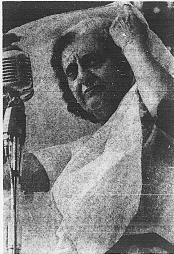
Après la décision de la Cour suprême, le Premier ministre Indira Gandhi a déclaré, hier, à ses partisans massés devant sa résidence de New Delhi, que son leadership était essentiel au progrès de l'Inde.

Par ailleurs, tous les partis d'opposition indiens, à l'exception du parti communiste pro-soviétique, ont annoncé qu'ils lanceraient une campagne nationale si Mme Indira Gandhi ne démissionnait pas.