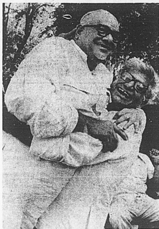
Un ami du leader socialiste indien Raj Narain, le tombeur de Mme Indira Gandhi, lui appliquant, hier, une amicale "prise de l'ours" pour le féliciter de la décision de la Cour suprême privant le Premier ministre indien de son droit de vote.

Quelques instants après que le jugement eut été rendu public, les membres du gouvernement et les dirigeants du parti du Congrès se sont rendus à la résidence du premier ministre pour discuter des conséquences de la décision de M. Krishna Iyer.