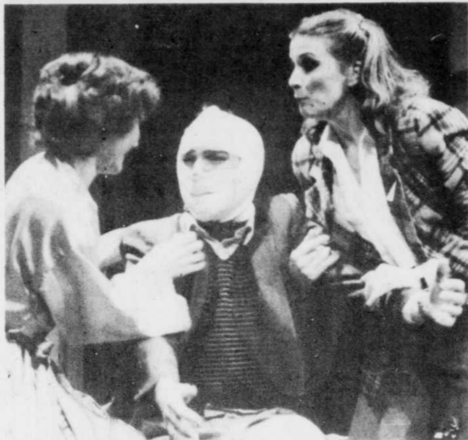
Une scène qui révèle les grands talents de comédien de Michel Rivard (l'ex-membre de Beau Dommage), dans le rôle de "Ramsès".

Calqué sur la comédie de boulevard classique dans laquelle amant, mari et femme se succèdent et s'entremêlent à coups de portes que l'on clique. Le garçon d'appartement utilisera plutôt pour marquer le rythme d'une manière éfrénée le jeu tout aussi essouffant des lam-