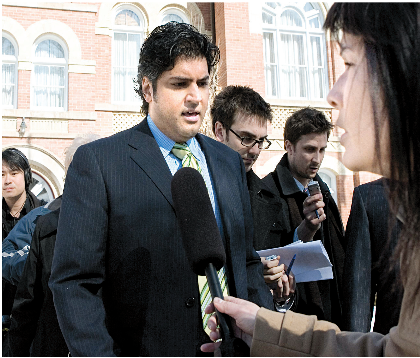
Rahim Jaffer était jusqu'à l'automne 2008 député d'Edmonton. Le 11 septembre dernier, il a été intercepté au nord de Toronto, au volant de sa Ford Escape. Il roulait à 93 km/h dans une zone limitée à 50 km/h.

Épinglé pour conduite en état d'ébriété et possession de cocaïne