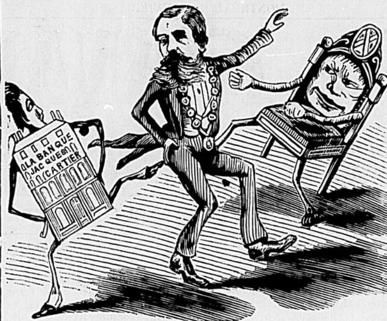
POSITION CRITIQUE DU MAIRE DE MONTREAL.

Ces jours derniers elles ont eu une querelle qui a eu les suites les plus fâcheuses. Elles nourrissent l'une pour l'autre une de ces haines implacables qui entrent dans le sang des familles pour être transmises à leurs descendants jusqu'à la consommation des siècles, une de ces haines, disons-