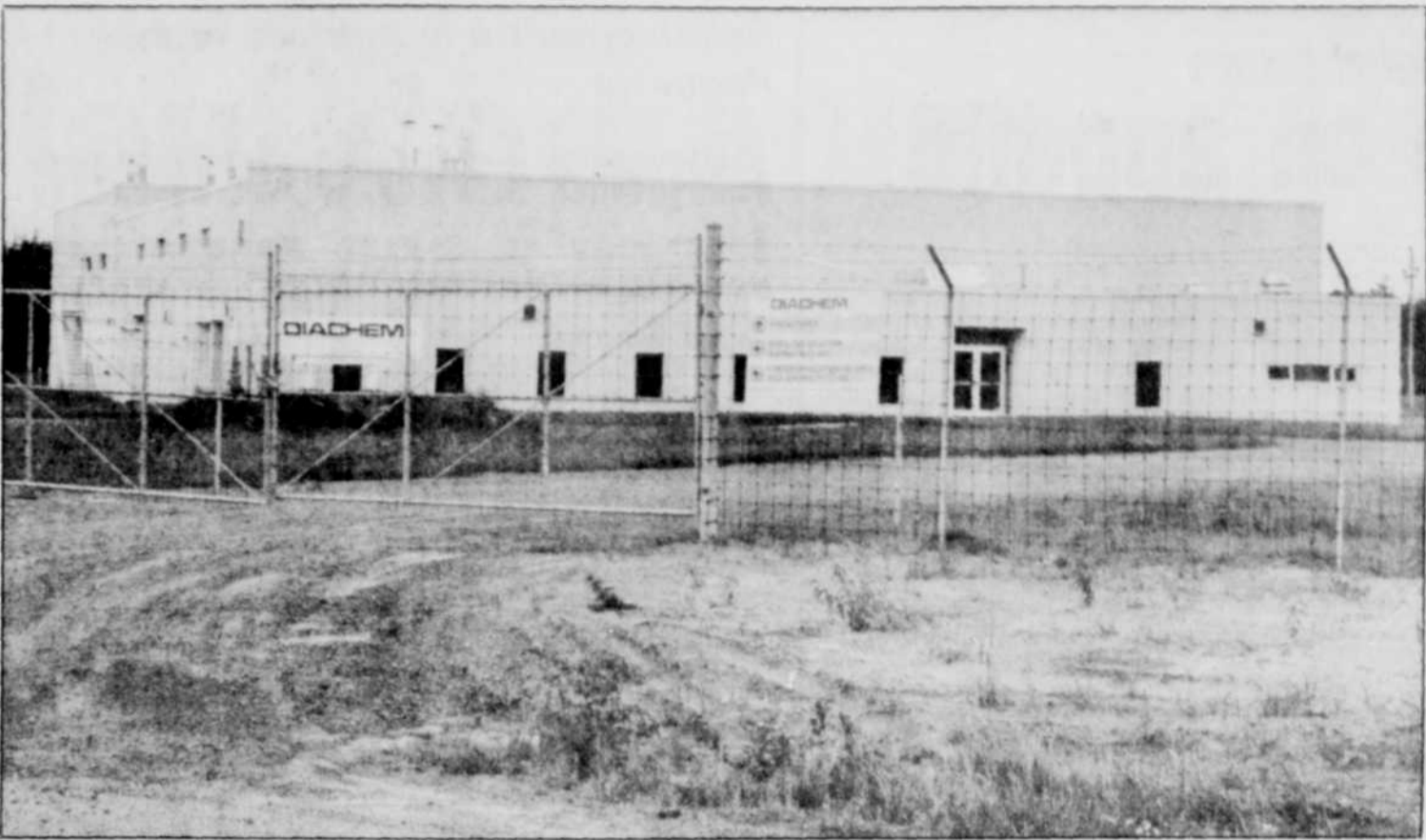
L'usine Diachem, qui est située dans le parc industriel numéro 2, à Trois-Rivières, investira près de $3 millions dans ses installations. La contribution du Fédéral représentera le tiers de ce montant.