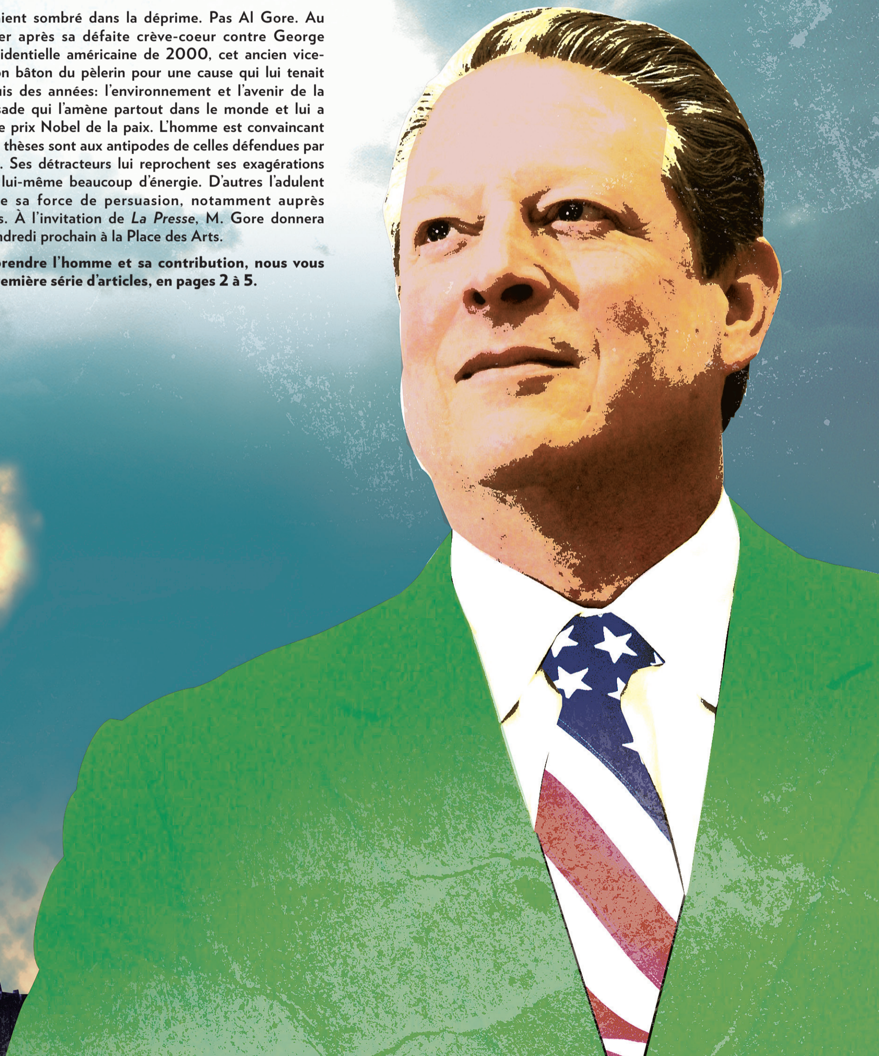
ILLUSTRATION KEVIN MASSÉ, LA PRESSE

Pour mieux comprendre l'homme et sa contribution, nous vous présentons une première série d'articles, en pages 2 à 5.