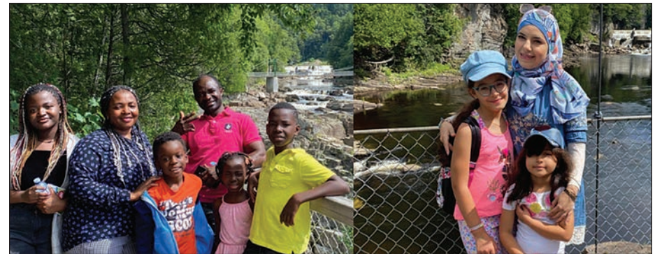
Ressource espace familles a organisé 11 sorties en plein-air et culturelles.

Ce projet, effectué en partenariat avec le Consulat général des États-Unis à Québec et financé par l'ambassade des États-Unis à Ottawa, a ajouté pour sa 2 e édition ces activités collectives aux activités individuelles. Au total, c'est plus de 2250 personnes qui auront pris part au défi qui se termine le 31 décembre prochain. Pour plus d'informations: www.defiplusloinensemble.com . ■