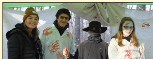
L'événement consiste en un parcours de peur d'environ deux kilomètres à travers le parc de la Rivière et animé par les jeunes des maisons des jeunes de L'Ancienne-Lorette et de Sainte-Foy.