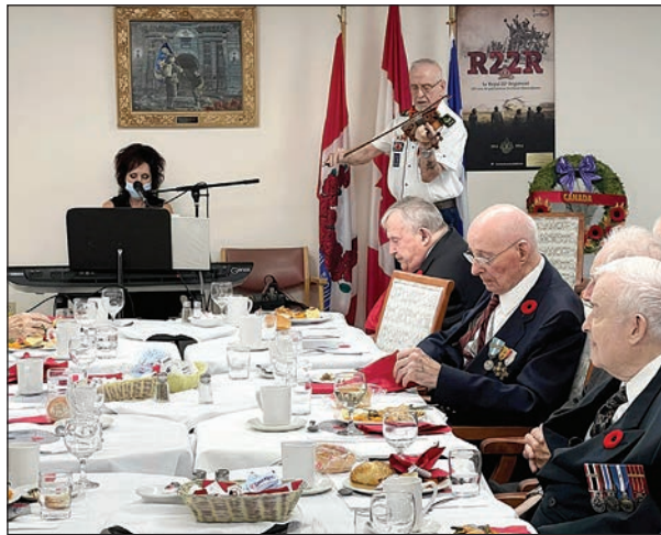
Un dîner spécial pour les vétérans pour souligner le Jour du Souvenir.