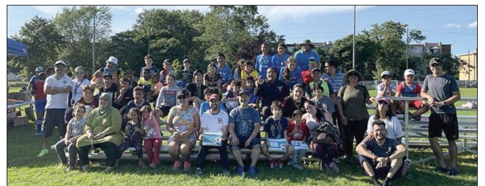
Au total, c'est plus de 2250 personnes qui auront pris part au défi qui se termine le 31 décembre prochain