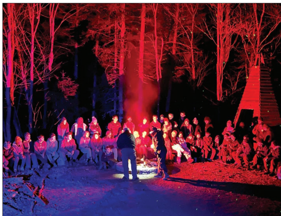
La traditionnelle cérémonie de la bûche réunit tous les cadets le soir tombé.