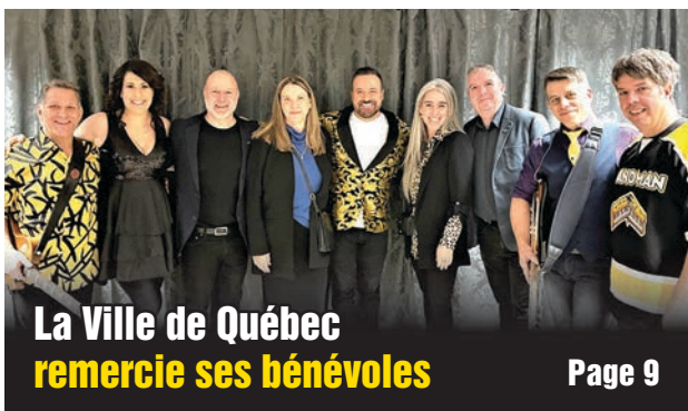
La Ville de Québec remercie ses bénévoles Page 9