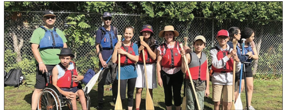
Plus de 1650 personnes ont participé à ces activités favorisant le vivre-ensemble, les saines habitudes de vie.