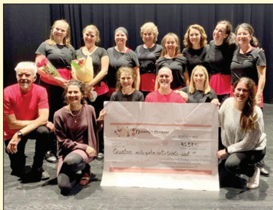
La troupe de danse Nouvelle époque remet plus de 4500 $ à l'organisme Vide ta sacoche.

(YG) La troupe de danse Nouvelle époque présentait récemment son spectacle-bénéfice intitulé l'Ornithorynque dansant, chantant, riant, au profit de l'organisme Vide ta sacoche, au Musée national des beaux-arts du Québec. En plus d'avoir enchanté son public, la troupe a fait toute une surprise à l'organisme, en lui remettant un chèque d'une somme de 4537 $.