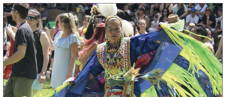
Une sortie au pow-wow de Wendake.