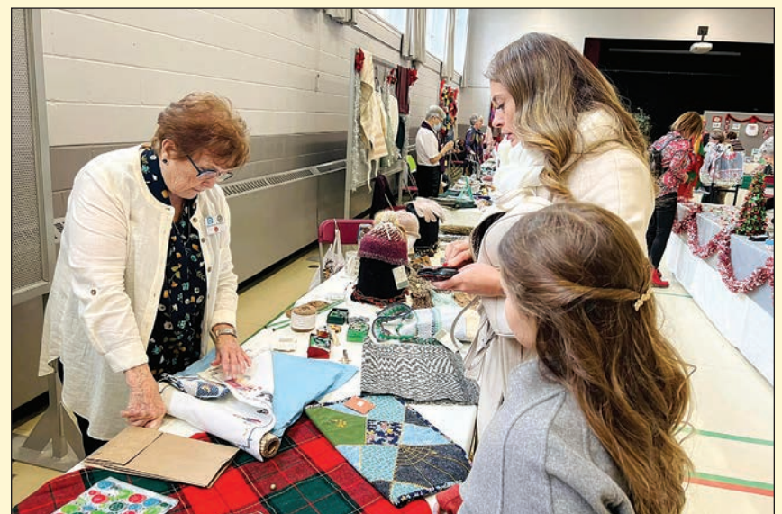
La députée de Jean-Talon a effectué plusieurs achats pour ses proches et pour elle-même.

Le salon s'est tenu les 12 et 13 novembre dernier. Les tables étaient garnies d'objets de toute sorte. Les visiteurs ont été nombreux à se rendre à ce Salon. ■