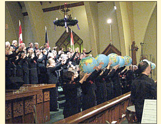
Le Chœur du Vallon chantera Noël sous le soleil le dimanche 18 décembre à 14 h à l'église Sainte-Ursule.

(YG) Le Chœur du Vallon chantera Noël sous le soleil le dimanche 18 décembre à 14 h à l'église Sainte-Ursule. Il vous interprétera des Noëls de pays où il fait beau chaud, situés en Europe, en Amérique centrale et du Sud, en Australie et à Hawaï, avec plus de 70 choristes et instrumentistes, sous la direction de Gisèle Pettigrew. ■