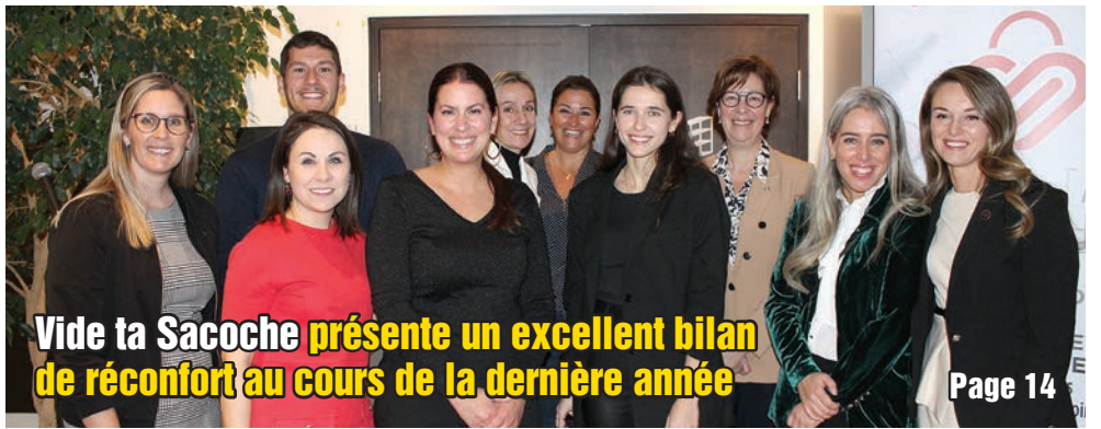
Vide ta Sacoche présente un excellent bilan de réconfort au cours de la dernière année Page 14