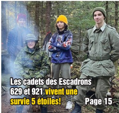
Les cadets des Escadrons 629 et 921 vivent une survie 5 étoiles! Page 15