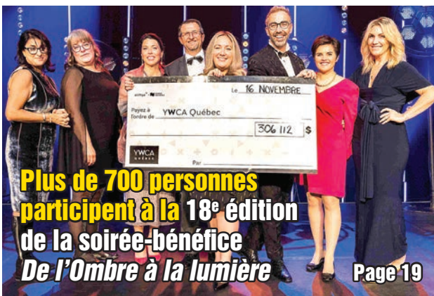
Plus de 700 personnes participent à la 18 e édition de la soirée-bénéfice De l'Ombre à la lumière Page 19