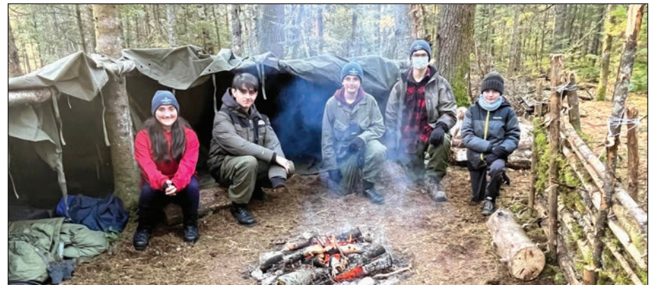
Des cadets du secteur de Sainte-Foy des Escadrons 629 et 921.

Chaque année, il s'agit de l'activité la plus appréciée par les jeunes et, cette année enfin, la pandémie semble bien loin d'eux. L'expérience cadet, c'est tout simplement, des activités gratuites pour les jeunes de 12 à 18 ans. Alors n'hésitez pas à vous joindre à eux pour d'autres activités aussi enrichissantes et uniques! Les soirées d'entraînement diffèrent selon l'unité, mais vous pouvez vous inscrire tout au long de l'année. Si vous désirez vous joindre à l'Escadron 629 Kiwanis Québec, consultez le escadron629.ca et pour l'Escadron 921 L'Ancienne-Lorette, contactez-les au www.921.ca . ■