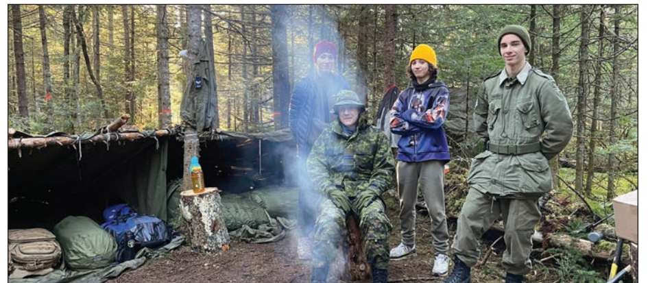
D'autres cadets du secteur de Sainte-Foy des Escadrons 629 et 921.