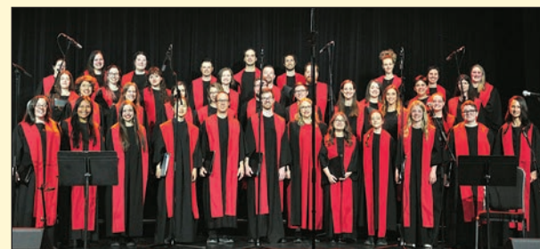
Le Chœur Ad Vitam présentera, le 3 décembre, son concert ayant pour titre Au rythme des étoiles à la salle Dina-Bélanger à Québec.

(YG) Le Chœur Ad Vitam présentera, le 3 décembre, son concert ayant pour titre Au rythme des étoiles à la salle Dina-Bélanger à Québec. Les portes ouvriront à 18 h 30 et le concert débutera à 19 h 30. Les choristes, âgés entre 12 et 30 ans, ont élaboré un programme de concert qui charmera les mélomanes de tous âges. Les 46 jeunes chanteront des airs de Noël avec des harmonisations tantôt jazz, tantôt pop et tantôt classiques. Ces arrangements particuliers vous feront redécouvrir les grands classiques de Noël.