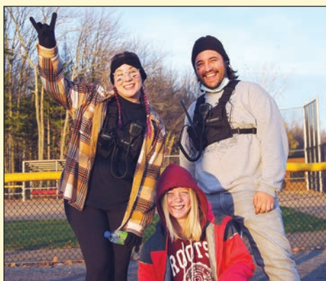
Les Chroniques du Sickulier sont revenues pour une 3 e année à la Ville de L'Ancienne-Lorette à l'occasion de l'Halloween.