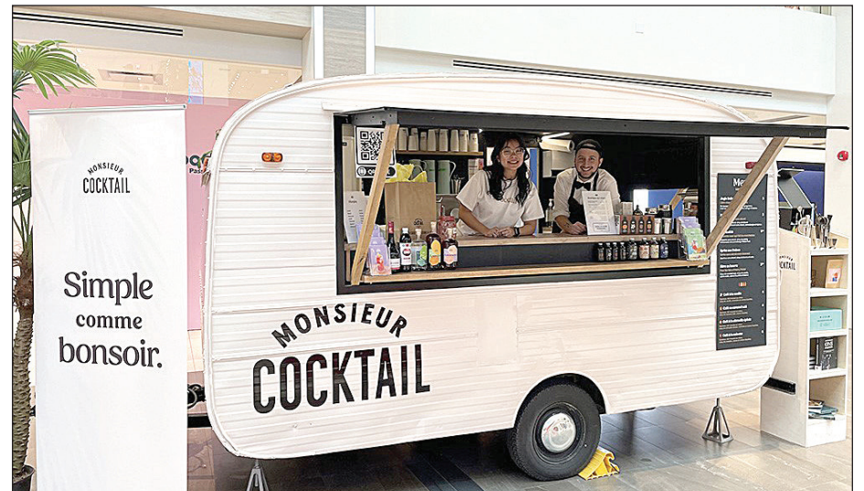
C'est tout près de l'impressionnant sapin de Noël central de Laurier Québec qu'est garée la roulotte aux allures rétro de Monsieur Cocktail.

Depuis 2015, Monsieur Cocktail démocratise le cocktail à la maison en le rendant accessible, simple et facile à