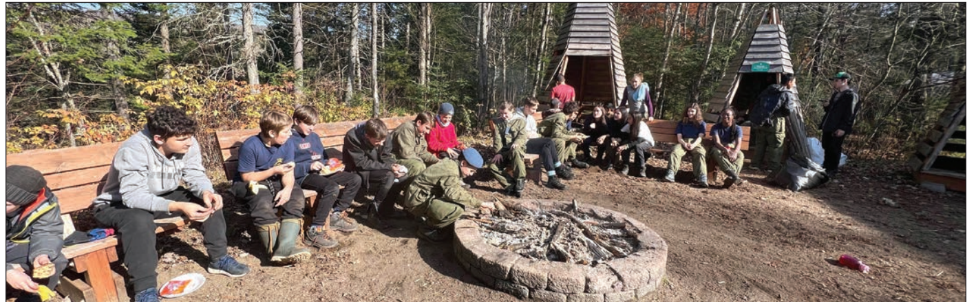
Des cadets des Escadrons 629 et 921 lors de la survie du 21-22 et 23 octobre dernier.

« Lorsque nous entendons le mot survie, nous pensons à des conditions extrêmes et misérables. Toutefois, avec les cadets c'est plutôt une fin de semaine avec de la nourriture, des guimauves sur le feu et sous les étoiles, mais surtout une fin de semaine entre amis ajoute l'adjutant