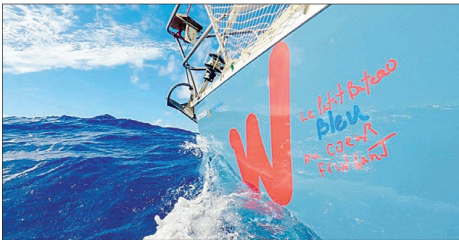
Porté par un rêve qu'il a toujours eu, M. Marsh choisit d'entreprendre, seul, une double traversée de l'Atlantique sur un petit voilier de 28 pieds, baptisé Le Petit Bateau Bleu au Cœur Fringant .