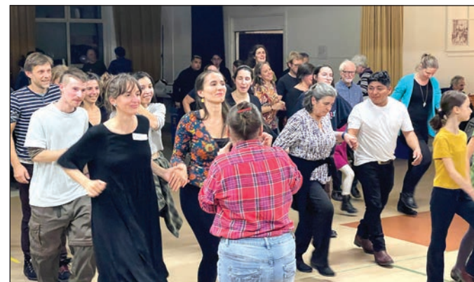
Cette soirée organisée, par la Casa Latino-américaine de Québec, visait à faciliter la découverte culturelle de plusieurs pays hispanophones ainsi que la rencontre de citoyens provenant de ceux-ci.