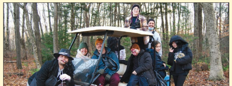
De nombreux jeunes bénévoles ont mis la main à la pâte.