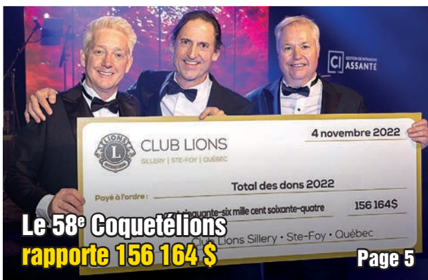
Le 58 e Coquetélions rapporte 156 164 $ Page 5