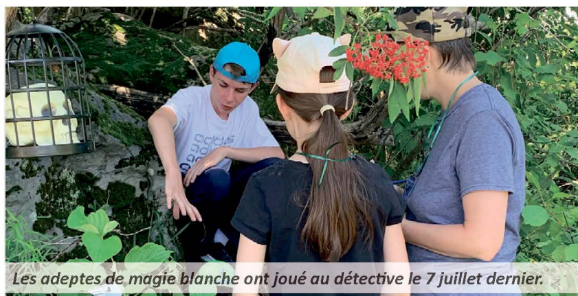
Les adeptes de magie blanche ont joué au détective le 7 juillet dernier.

Le 7 juillet dernier, sous un soleil de plomb, de courageuses futures sorcières et de courageux futurs sorciers ont prêté main-forte à des partenaires de L'ÉcoRéussite de L'Islet-Sud pour retrouver le grimoire interdit qui avait été volé.