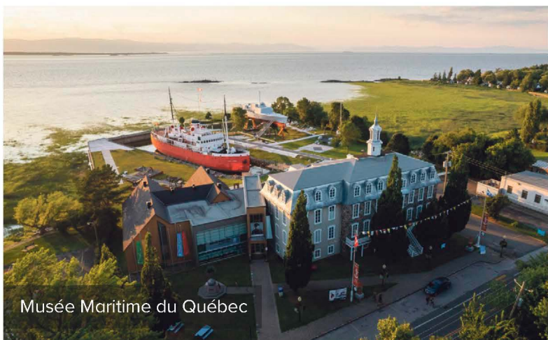
Musée Maritime du Québec