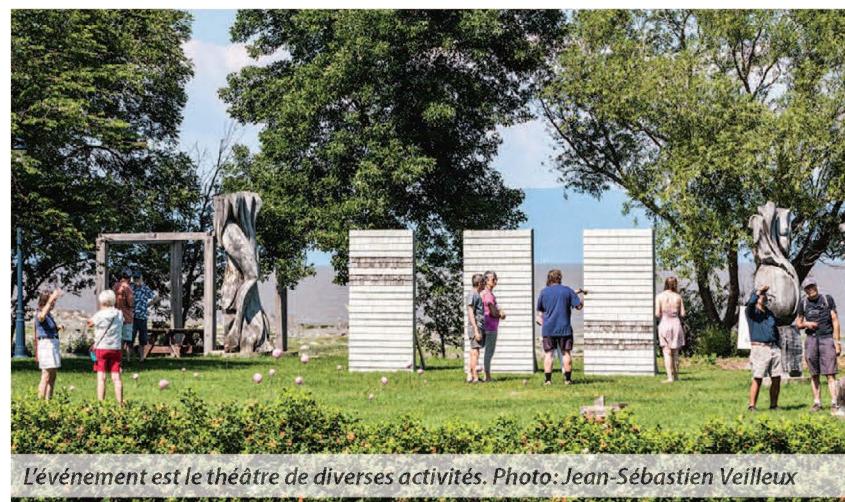
L'événement est le théâtre de diverses activités.

Une exposition virtuelle en collaboration avec le Musée de la mémoire vivante, célébrant le 40 e anniversaire du Rendez-vous 1984, revisitera les moments