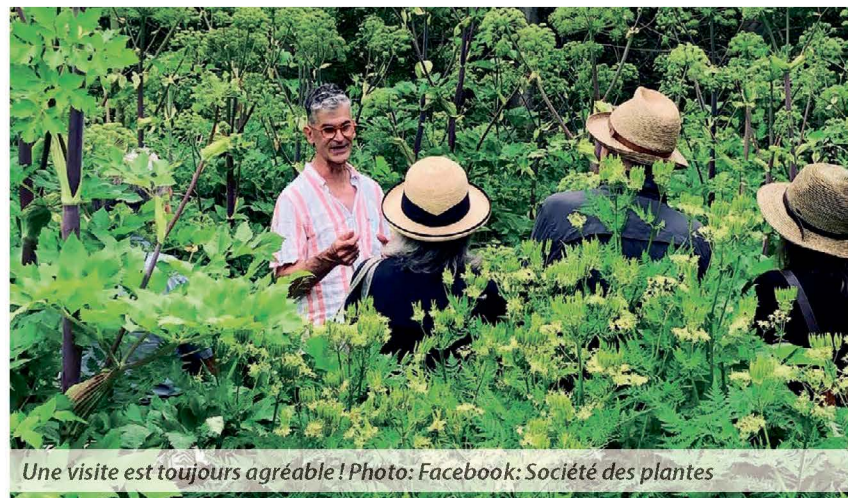
Une visite est toujours agréable !

La nouvelle exposition, intitulée Les soins de la tomate , sera inaugurée le