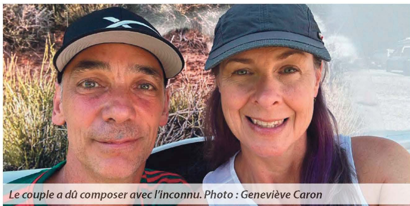
Le couple a dû composer avec l'inconnu.

Cette aventure au Texas restera gravée dans leurs mémoires comme une preuve de leur capacité à surmonter les obstacles ensemble. « Nous avons beaucoup appris, et nous nous en souviendrons avec le sourire, conclut Frédéric. Rien ne peut nous empêcher de découvrir le monde. »