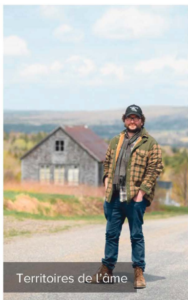
Territoires de l'âme