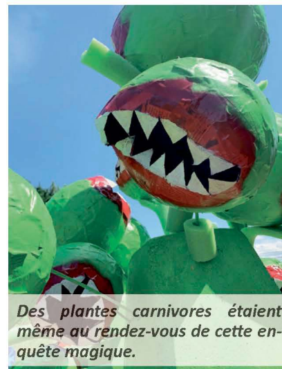
Des plantes carnivores étaient même au rendez-vous de cette enquête magique.