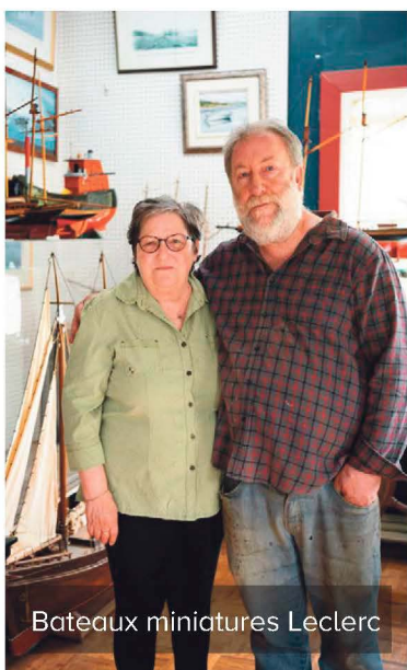
Bateaux miniatures Leclerc