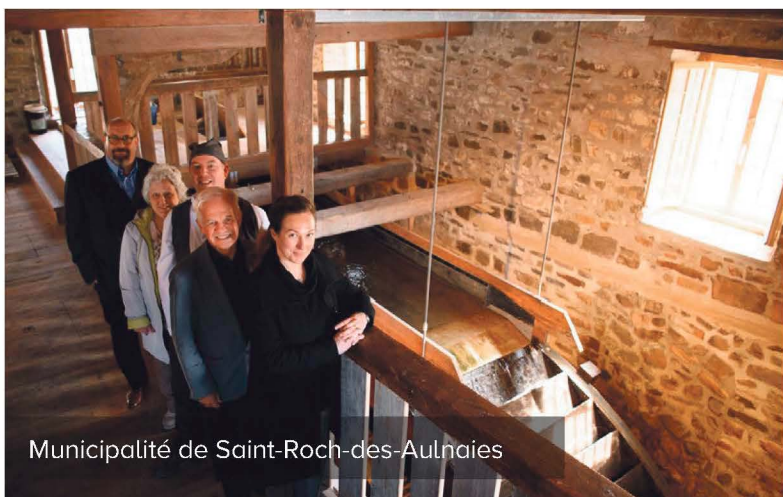
Municipalité de Saint-Roch-des-Aulnaies