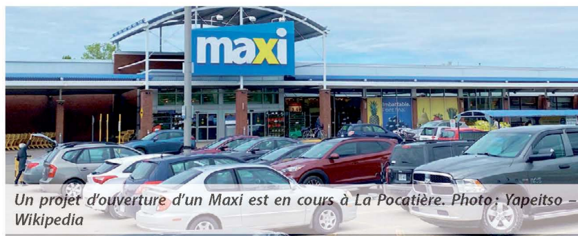
Un projet d'ouverture d'un Maxi est en cours à La Pocatière.

Maxi exploite déjà un supermarché à Saint-Pascal. L'arrivée de ce concurrent à La Pocatière, qui se démarque par ses bas prix, viendra apporter de la concurrence aux épiceries qui s'y trouvent déjà.