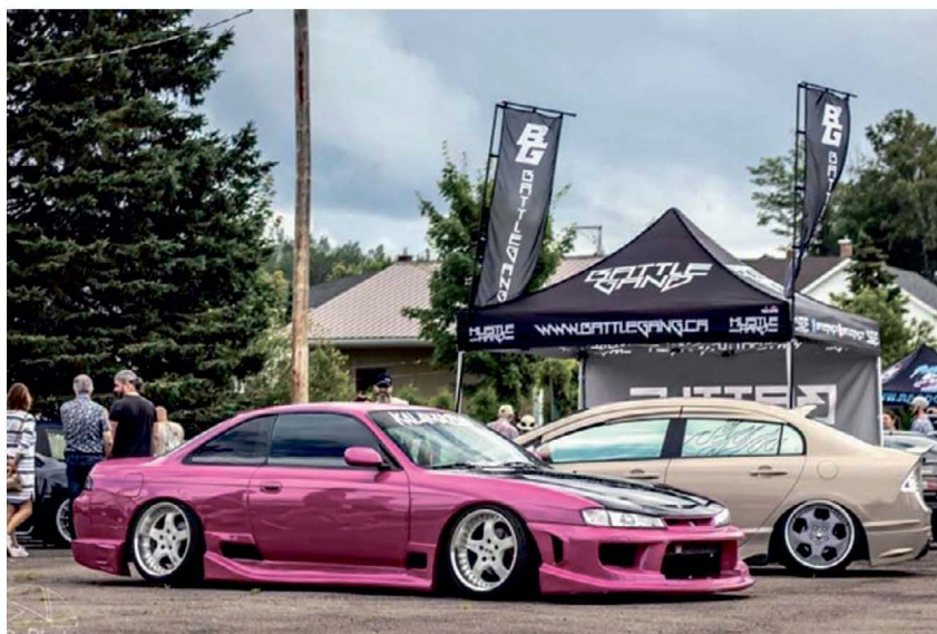
Les amateurs en auront plein la vue.