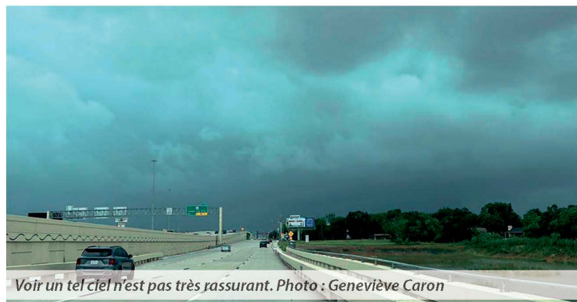
Voir un tel ciel n'est pas très rassurant.

La nuit du 7 au 8 juillet a été marquée par des turbulences intenses dans le véhicule récréatif loué par la famille. « C'était comme être dans un avion avec de grosses turbulences, ça brassait pas mal.