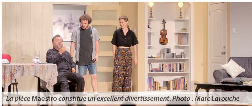
La pièce Maestro constitue un excellent divertissement.

Maestro s'inscrit dans cette tradition de théâtre d'été. La pièce allie humour et une pointe de folie, ingrédients essentiels pour une soirée réussie. La mise en scène de Carol Cassinat rend pleinement justice à l'œuvre de Claude Montminy.