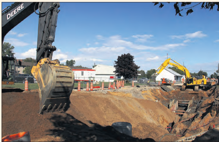
Les travaux d'infrastructures et de réaménagement du boulevard Dollard constituent un défi de taille, notamment en raison de la profondeur de la tranchée qui atteint environ 9 mètres.

Il faut le reconnaître : les travaux d'infrastructures et de réaménagement du boulevard Dollard constituent un défi de taille et ont été parsemés d'embûches : les pelles mécaniques doivent creuser à environ 9 mètres de profondeur; en outre, à plusieurs endroits, le roc se trouve près de la