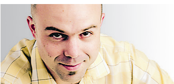
PHILIPPE RENAUD COLLABORATION SPÉCIALE

Après tout ce qu'on a enduré, qu'on n'en entende pas un se plaindre de la météo! Soit, la canicule ne frappait pas le centre-ville hier soir, et on a même vu quelques techniciens courir chercher une bâche pour abriter la console de son à la vue des gros nuages gris qui s'étaient invités. Mais la bonne brise qui a soufflé toute la soirée les a vite délogés, et les festivaliers, nombreux pour un dimanche soir, ont joyeusement goûté aux saveurs musicales à l'affiche.