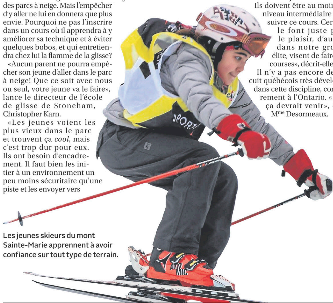
Les jeunes skieurs du mont Sainte-Marie apprennent à avoir confiance sur tout type de terrain.

Il n'y a pas encore de circuit québécois très développé dans cette discipline, contrairement à l'Ontario. «Mais ça devrait venir», croit M me Desormeaux.