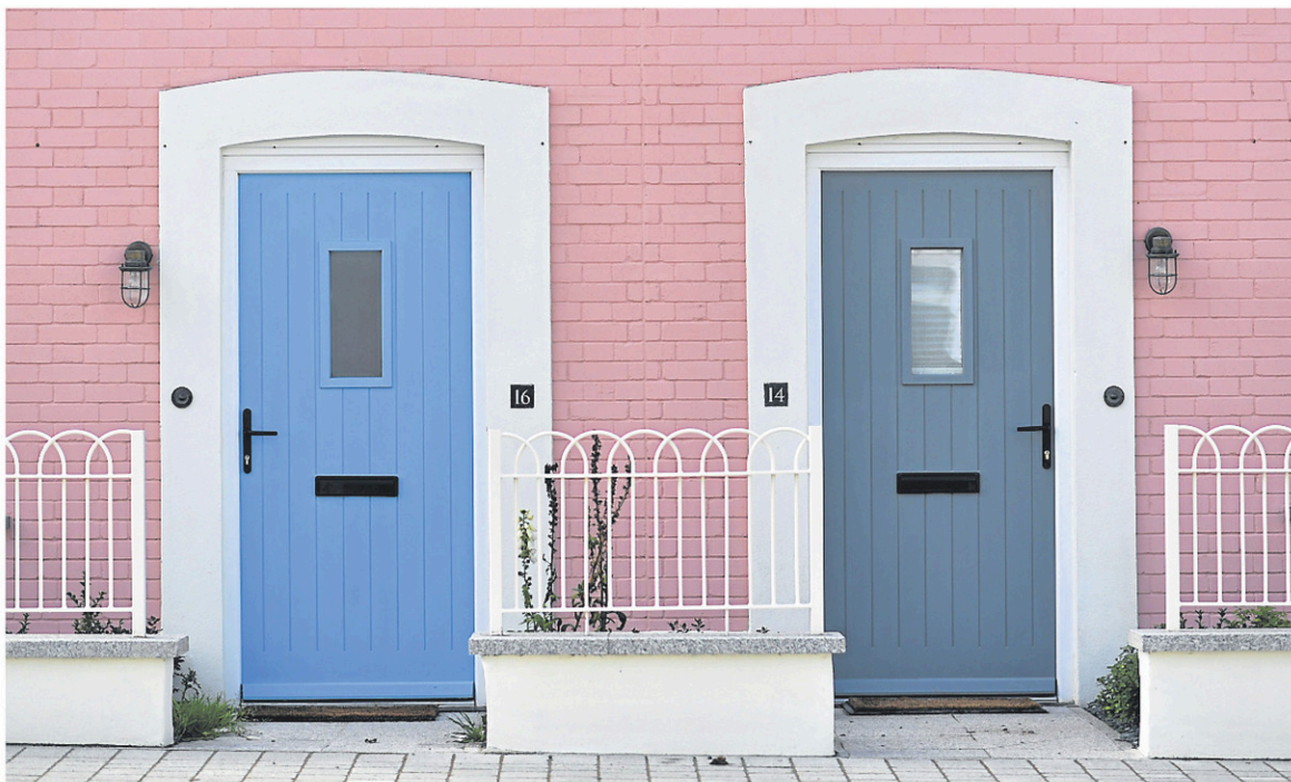
Les maisons neuves, d'un ou deux étages, s'alignent le long de rues propres aux noms corniques, avec leurs façades de pierre ou de plâtre pastel, rehaussées de toits d'ardoises typiques de ce coin du pays.

«Il est très impliqué [...] et se rend sur place deux fois par an», affirme