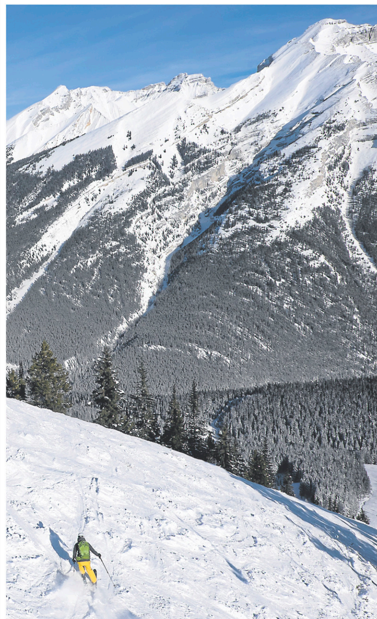
Le dénivellé de Norquay se compare à celui d'Orford.

DATE LIMITE D'INSCRIPTION : dimanche 10 décembre 2017 Le bébé doit être né entre le 1 er décembre 2016 et le 10 décembre 2017.