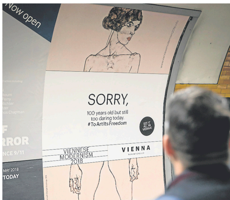
Les sulfureux nus par Egon Schiele sont au cœur d'une audacieuse campagne de l'office du tourisme de Vienne.

bandeau qui proclame: «PARDON, 100 ans d'âge et toujours trop audacieux de nos jours».