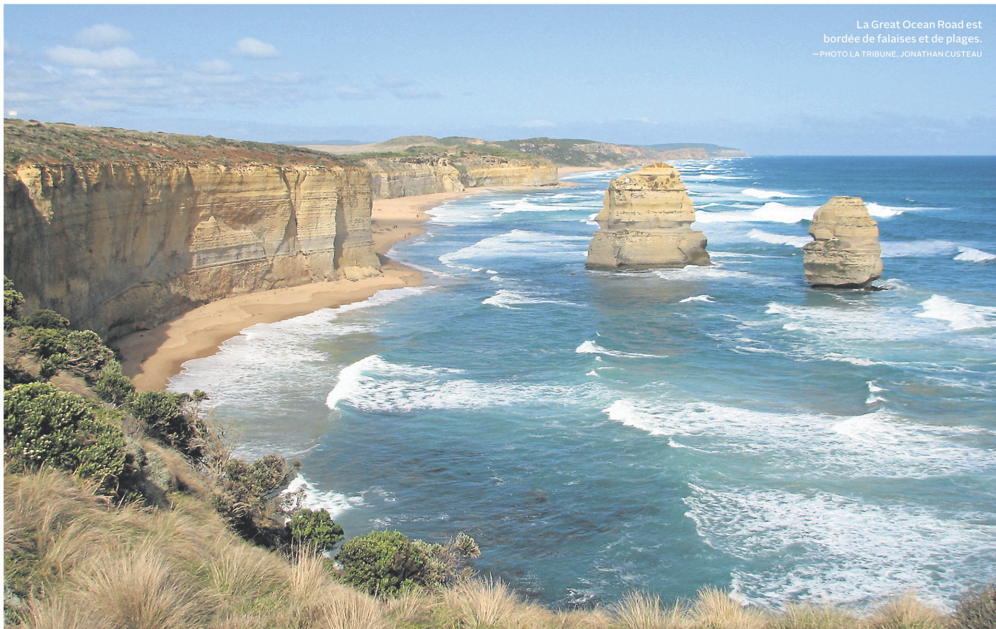
La Great Ocean Road est bordée de falaises et de plages.