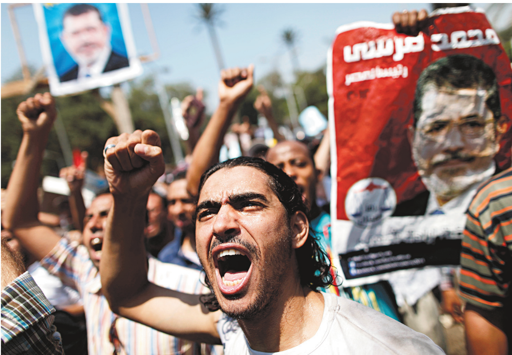
Le président Morsi parti, les Frères musulmans s'agitent.