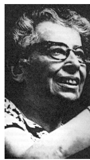
Hannah Arendt

Dans l'esprit d'Arendt, on pourrait citer en coupables ces systèmes où les individus sont superflus, agissant en ions interchangeables. Si l'un refuse, l'autre le fera, et l'obéissance aux règles prend le dessus, sans égard au sens des gestes posés. L'idée maîtresse d'Arendt étant ici qu'un esprit mauvais n'est pas une condition sine qua non à l'accomplissement d'une action répréhensible, mais que cette dernière peut simplement résulter d'un vide moral.