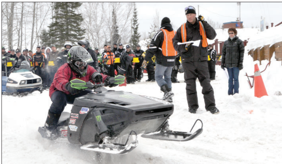
Un participant sur une motoneige antique.