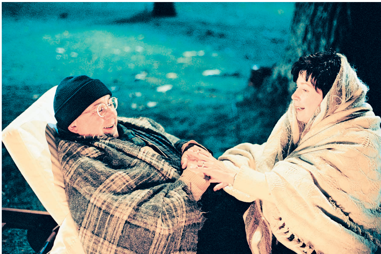
Rémy Girard et Dorothee Berryman dans Les Invasions barbares . Le film de Denys Arcand sera en compétition officielle au Festival de Cannes.

res en est à sa troisième participation en sélection officielle. Présenté en compétition en 1989, Jésus de Montréal avait raflé un Prix du jury. Quant à Stardom , il y a trois ans, il avait clôturé le festival, hors compétition. Arcand avait aussi participé à la Semaine de la critique en 1972 avec son premier long métrage, La Maudite Galette . On connaît par ailleurs le succès remporté en 1986 par Le Déclin de l'empire américain (dont Les Invasions barbares forment une suite) lorsqu'il a été présenté à la Quinzaine des réalisateurs.