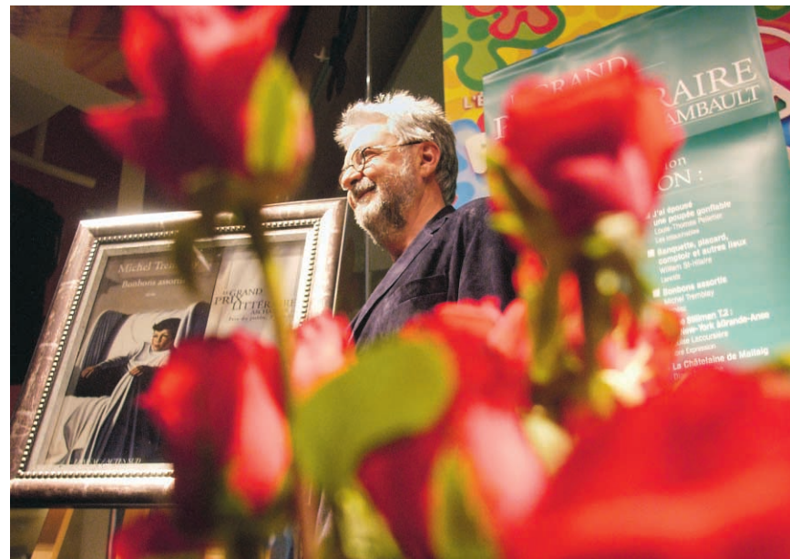
Michel Tremblay a reçu avec bonheur le Grand Prix littéraire Archambault. « Être reconnu par le public, c'est bon pour l'âme. »